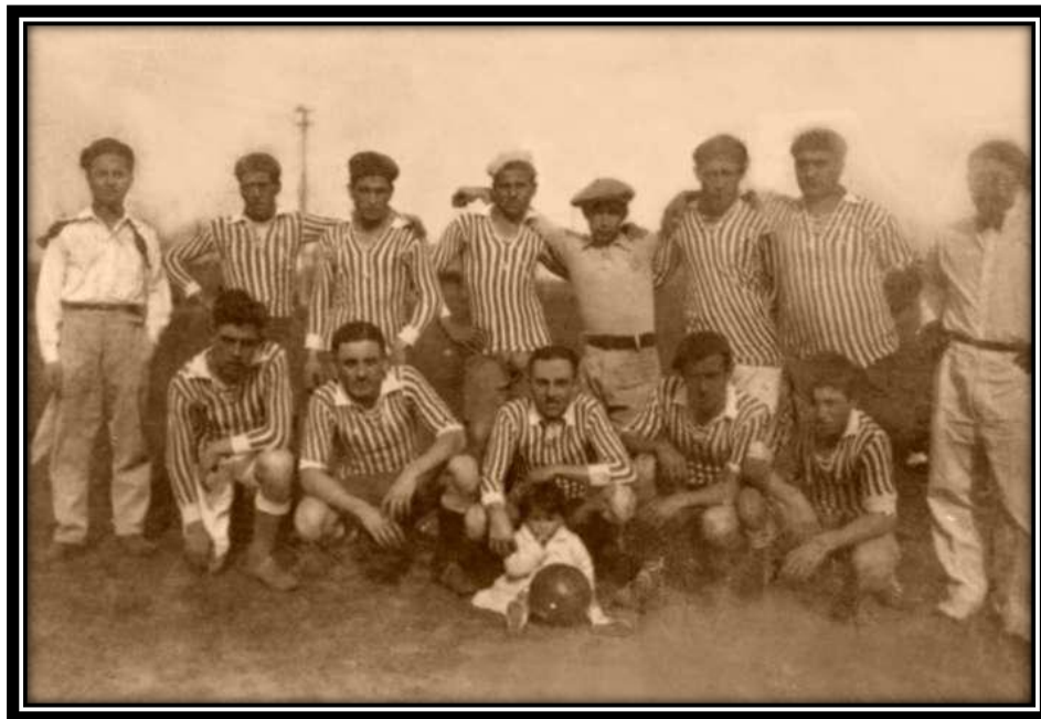
Equipo de fútbol del Club Sportivo “José Altube”

Partido tras partido, el Club fue creciendo y el 17 de agosto de 1926 incorporó el tenis, inaugurando las canchas que estaban ubicadas sobre la calle José C. Paz. Como todo acto deportivo, culminaron los festejos de este día con lucido baile.