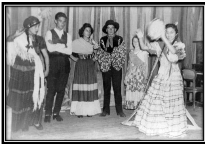
Cuadro artístico del Club