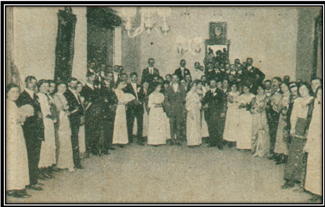
“Los bailes en el salón de Villa Altube”

Realizaba las mismas actividades que el Centro Recreativo “Juventud de Artesanos”, pero destinadas a las familias: bailes, reuniones sociales, pic nics, romerías populares, donde parte de lo recaudado se destinaba a auxiliar a familias necesitadas.