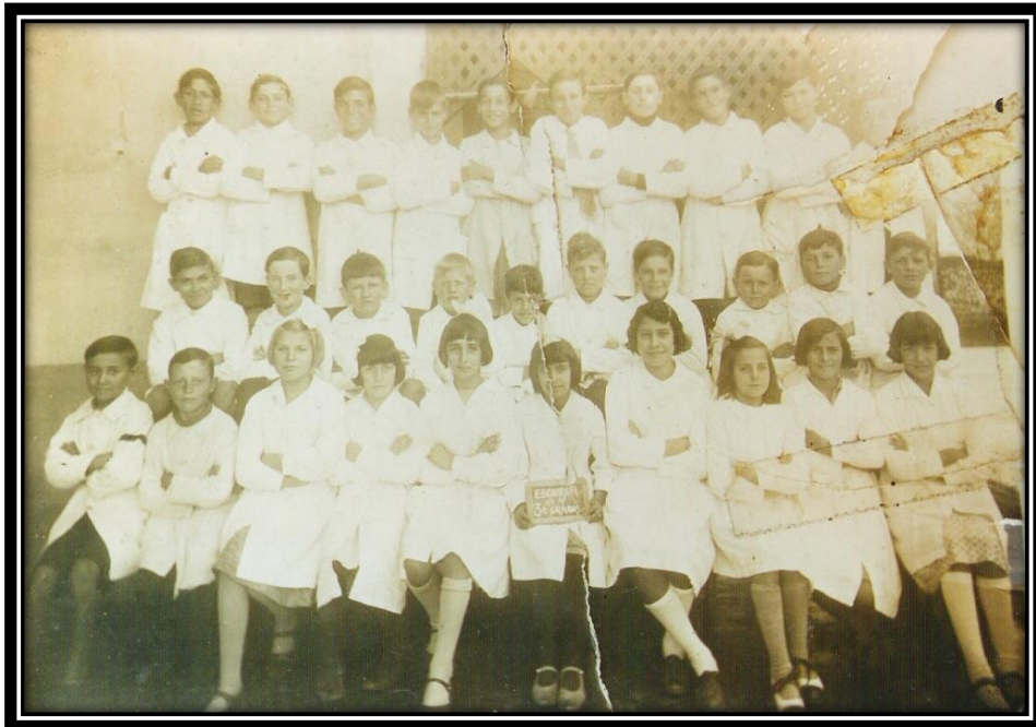
Alumnos de la Escuela Nº 4, actual Escuela Primaria Nº 1

Al mirar el aula, se la veía abarrotada, cincuenta y cuatro alumnos, allí estaba Catalina dando sus primeras clases. Al concluir el año escolar, treinta y un alumno pasaron a segundo grado y diecinueve quedaron un año más en primero. Diez de esos alumnos cursaban por tercera vez primer grado, de los cuales siete fueron promovidos; quince era la segunda vez que cursaban primer grado... Tiempos distintos a los nuestros, donde no había promoción automática.