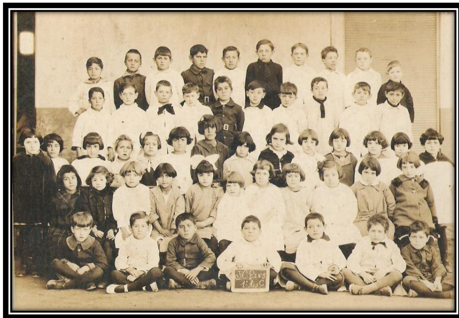
Alumnos de la Escuela Nº 5, actual Escuela Primaria Nº 2

La menor, Catalina María, al cumplir los ocho años, comenzó sus estudios primarios en la Escuela Nº 5, actual Escuela Primaria Nº 2. Allí se iniciará con los palotes, las vocales, sumas y restas... hasta tercer grado.