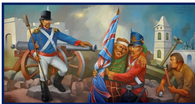
“Las Invasiones Inglesas, mural de Rodolfo Campodónico 4

Esa tropa gaucha es considerada precursora de los ejércitos patriotas; es fácilmente demostrable que también se alistaron a la hora de la convocatoria de Castelli y Belgrano para formar los ejércitos libertadores; marcharon hasta el Alto Perú y estuvieron allí donde la construcción de la Patria los demandó. Formaron parte de la victoria en la mayor epopeya de nuestra historia: la Emancipación Americana.