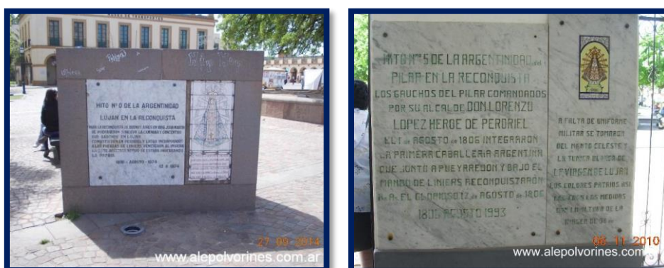
Hitos de la Argentinidad N° “0” en Luján y N° “5” en Pilar 5

Al cabo de los años y como resultado de lejanas evocaciones de la memoria, los sucesos de la Reconquista se fueron reflejando en la geografía y el aspecto institucional de la región de las Cuarenta Leguas como huellas de la construcción de la identidad nacional. De esta forma, junto al Cabildo de Luján fue nominado un lugar definido como “el Hito Cero de la Argentinidad”, y el lugar donde se libró el combate de Perdriel, en el actual partido de Gral. San Martín, fue “el Hito Número Uno”. El trayecto recorrido tanto por los gauchos de Pueyrredón como por las tropas de Liniers después de su desembarco en el Tigre, demarca otra serie de mojones. Se los ha denominado “Hitos de la Reconquista”: uno está ubicado en Carapachay, otro en Villa Martelli y el tercero del municipio de Vicente López, en Florida; en Boulogne Sur Mer, San Isidro, en el Camino del Fondo de la Legua y Thames, está el “Hito de la Chacra de los Márquez”, donde descansó Juan Martín de Güemes en aquellas circunstancias, y el “Hito Número Seis” emplazado en la plaza de la ciudad de Salto, recuerda la participación de los paisanos de esa localidad en la Reconquista. La “Muy fiel y Reconquistadora” ciudad de Montevideo, alberga a su vez otros monumentos recordatorios.