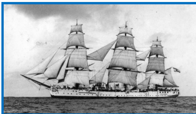
Fragata ARA “Presidente Sarmiento” 1

El 31 de agosto de 1897 fue botado el buque escuela y bautizado como Fragata ARA “Presidente Sarmiento” , nave que a cargo del teniente de navío Enrique Thorne zarpó de Liverpool el 14 de julio de 1898, con escalas en Vigo y en Génova, que navegando sólo a vela arribó a la rada exterior del puerto de Buenos Aires el 10 de septiembre de 1898, en homenaje a la “Fragata Sarmiento” se impuso su nombre a la Escuela Primaria N° 11, entonces Escuela N° 52 de General Sarmiento , ubicada en el barrio 9 de Julio.