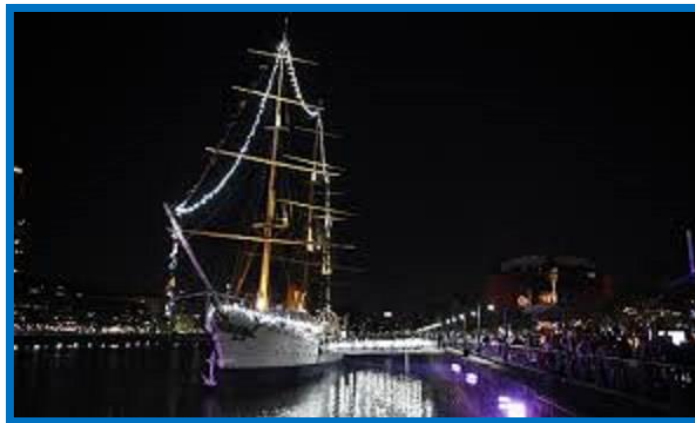
Museo Fragata Ara “Presidente Sarmiento” en Puerto Madero

Por otro lado, en 2016 la Convención de la Haya le otorgó el Emblema Azul, estableciendo así su protección como patrimonio cultural de la Nación en caso de conflicto bélico o emergencia.