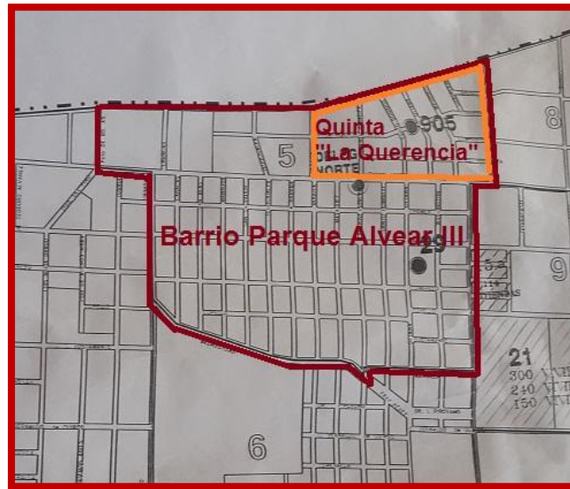
Quinta “La Querencia” dentro de los límites de Parque Alvear III