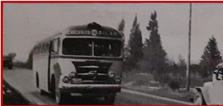
Colectivo N° 141 transitando por la Ruta 8 frente a la Quinta “La Querencia”