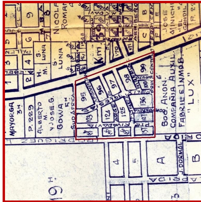
Plano de subdivisión de la Quinta "La Querencia"

confeccionado en enero de 1966, mediante expediente 58-50-66, dominio inscripto bajo el N° 712.