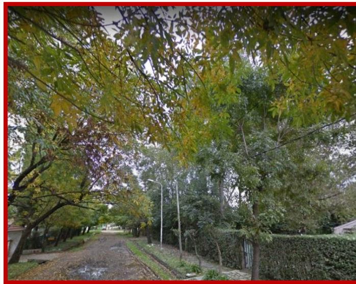
2014: Calle Ottawa