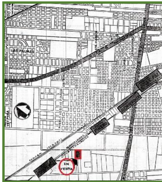
Ubicación del loteo

El folleto editado por la firma Vinelli informaba que el loteo se ubicaba en José C. Paz, próximo a la Estación Roosevelt y a la “importante” Ruta 197 “pavimentada, en una zona de gran porvenir”.