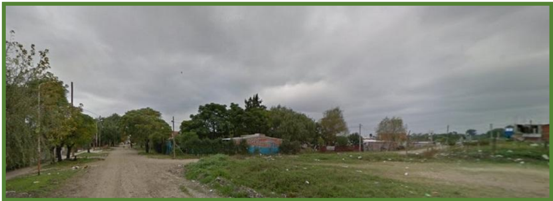
2014: Vista del loteo desde la esquina de “Nike” y “Nautilus” actuales Gorriti y Trelles

Según la Ordenanza N° 492/03 sancionada por el Honorable Concejo Deliberante de José C. Paz el 17 de diciembre de 2003, este loteo se encuentra ubicado dentro los límites del Barrio “La Cava” (N° 37).