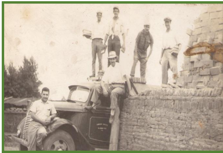
Horno de Sarrible

de 1957 se le impuso el nombre de “Vucetich”. El resto eran fracciones rurales, algunas dedicadas al pastoreo, en otras se habían instalado varios hornos de fabricación de ladrillos comunes, entre los que podemos mencionar a los de Sarrible, Barbaccia, Messina y Centofanti, Salviani, Cacciacarne, Mansur, Basilico, Giacomo de Nadai y los de los hermanos Primiterra, entre otros. Vecino al loteo se encontraban dos parcelas rurales, las 115 d y 115k, que habían sido adquiridas por la Cerámica Argital, de donde extraían tierra que era utilizada como materia prima para la fabricación de ladrillos huecos y tejas coloniales, formándose un gran pozo de hasta cuatro metros de profundidad, denominado “cava”, que entre el agua de lluvia y las aguas surgentes dada la profundidad del pozo se fue formando una laguna, a la que se le dio el nombre de “Juventud”.