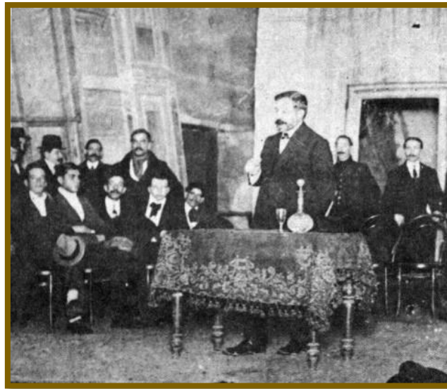
Juan B. Justo brindando una conferencia 2

Al poco tiempo viajó a Europa (Austria, Francia, Suiza, Alemania), donde perfeccionó sus conocimientos. A su regreso en vísperas de 1890, se presentó a concurso para optar al premio “Montes de Oca” por su trabajo Resección parcial y temporaria de la bóveda del cráneo . En esa fecha fue miembro de la comisión directiva de la Unión Cívica de la Juventud, y actuó en la jornada del 26 de julio, curando heridos junto al practicante Nicolás Repetto. Ingresó al hospital de Crónicos, y desempeñó provisoriamente la presidencia del Círculo Médico Argentino. En 1892, fue profesor de cirugía en la Facultad de Medicina, y al mismo tiempo jefe de Clínica del servicio del profesor Aguilar en el hospital San Roque (hoy Ramos Mejía).