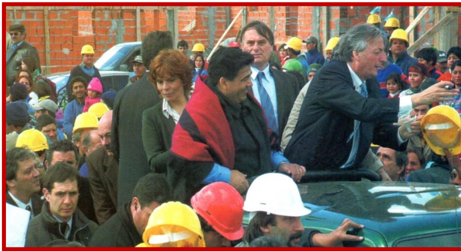
Visita a José C. Paz del Presidente Néstor Kirchner

El primer plan fue el Programa Federal de Emergencia Habitacional (Techo y Trabajo), que combinó dos objetivos: la construcción de viviendas y la generación de empleo, a partir de cooperativas de trabajo conformadas por los beneficiarios del Programa Jefas y Jefes de Hogar.