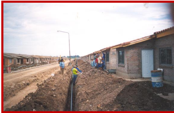
Las obras avanzan