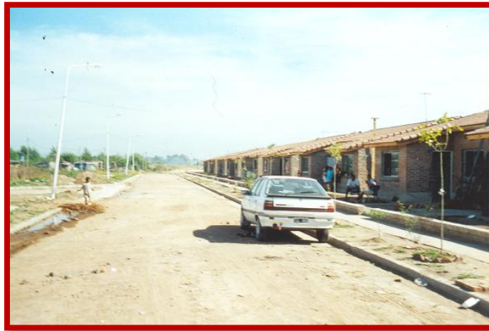
Primeros 600 cooperativistas en su casa propia mientras continuaba la construcción de las 400 restantes