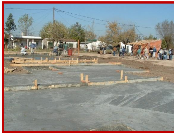
Iniciando la obra de las 1.000 viviendas por medio del Programa Federal de Emergencia Habitacional (Techo y Trabajo) sobre Avenida Saavedra Lamas