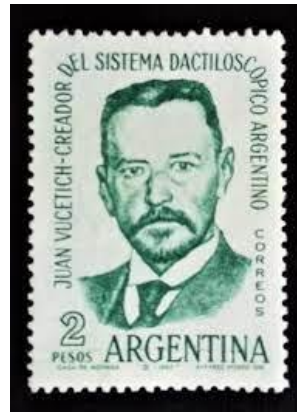
Estampilla en homenaje a Juan Vucetich (1962)

Así Juan Vucetich cumplió ampliamente su función en la vida, con aquel viejo proverbio “tener un hijo, escribir un libro y plantar un árbol”.