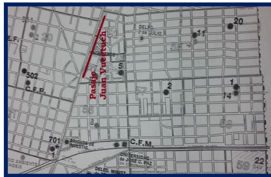
Pasaje “Juan Vucetich”

Además, se honra con su nombre al pasaje “Juan Vucetich”, arteria que deslinda el corredor aeróbico de la Av. Hipólito Yrigoyen (Ruta 197) y los barrios General Sarmiento, Arquitectura y FOECYT, desde el pasaje Lanús hasta el final del corredor.