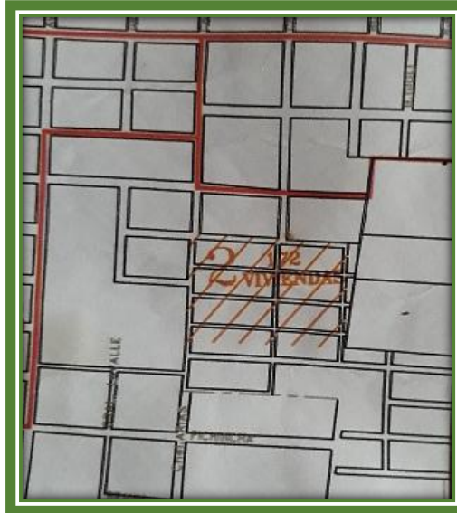
Plano indicando las manzanas donde se construyeron las 172 viviendas

El 26 de enero de 2008, comenzó la mudanza de los vecinos inaugurándose de este modo las 172 viviendas construidas mediante el Plan Federal de Viviendas, sobre la calle Coronel Arias, surgiendo el Barrio “Alfonsina Storni”.