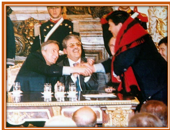
Firma de los convenios en la Casa Rosada

Firmados los convenios necesarios con la Nación y con la Provincia, se comenzó a concretar los proyectos seleccionados. Uno de ellos preveía la construcción de 172 viviendas, en el inmueble designado catastralmente como Circunscripción III, Sección P, Manzana 601, Parcelas 10 y 11, según plano 48-98-63, con frente a la calle Arias.