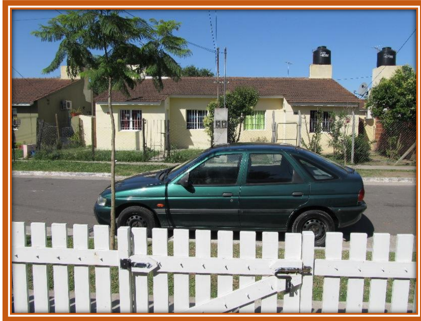
Vista del barrio en diciembre de 2011