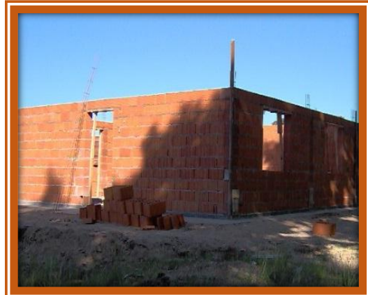
Día a día avanza la construcción de las 172 viviendas