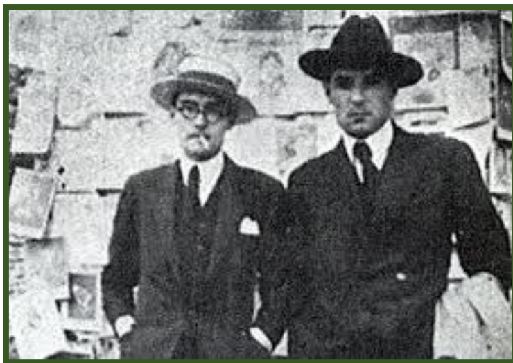
Conrado Nalé Roxlo y Roberto Arlt 4

cartas (treinta y ocho carillas escritas en papel de envolver con letra apretadísima), las que lo mantuvieron conectado al mundo de la literatura cuando un par de años antes y debido a la situación económica, había tenido que tomar un empleo de cajero en un almacén de Ramos Generales de la ciudad de Posadas.