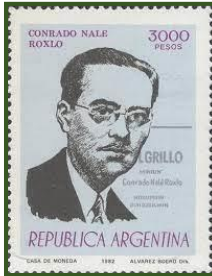
“La Escuela de las Hadas” de Conrado Nalé Roxlo Sello postal de Conrado Nalé Roxlo editado en 1982