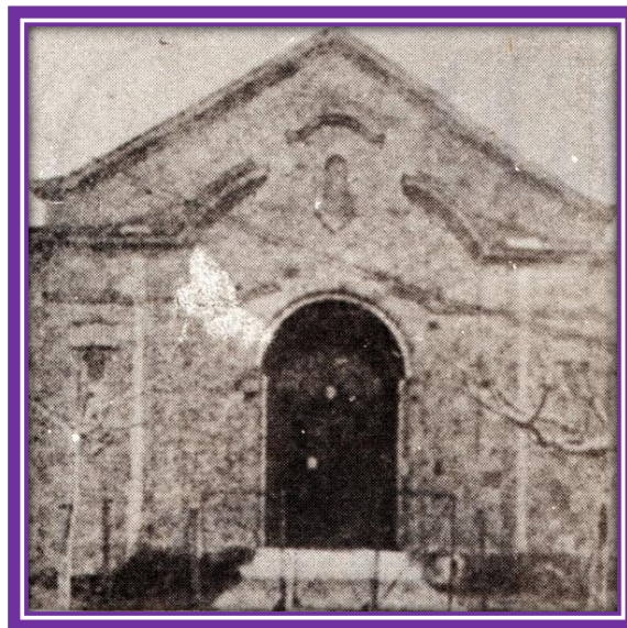
Frente Iglesia “San José”