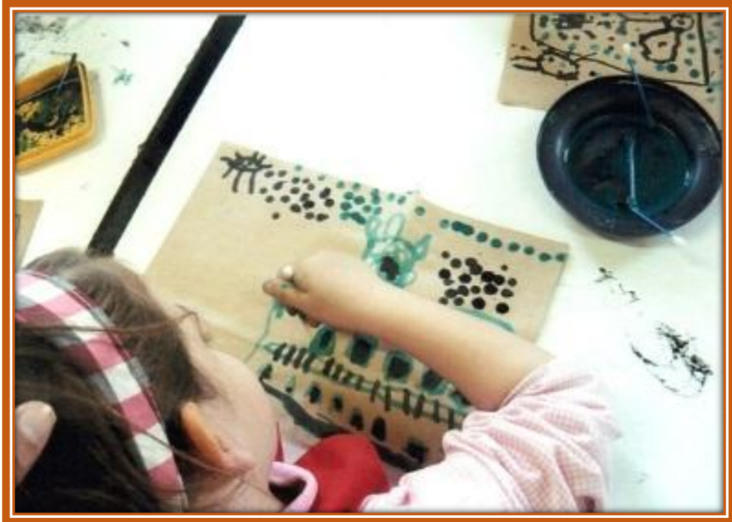
Alumna del Jardín de Infantes Nº 914 pintando