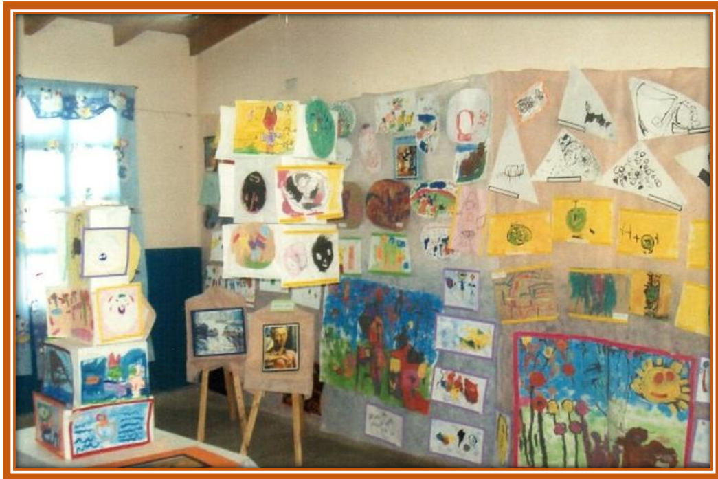
Muestra de trabajos de los alumnos del Jardín N° 914