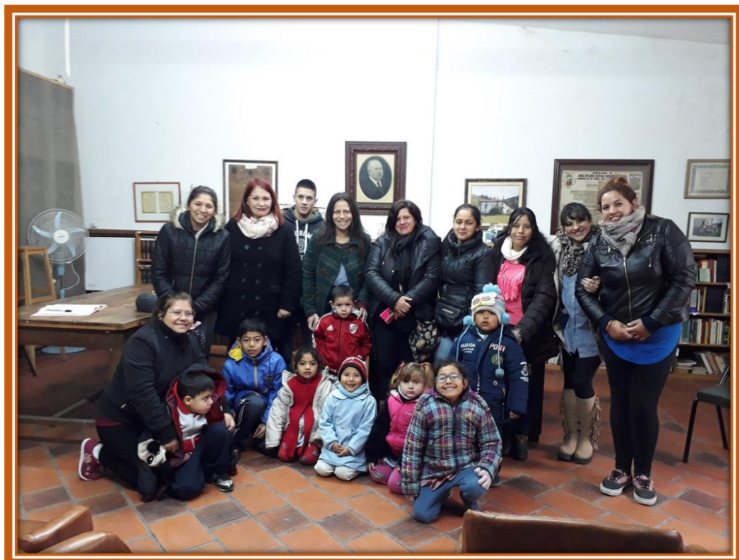
Visita de alumnos, docentes, directivos y papás del Jardín N° 914 para entrevistar al Director del Museo Histórico de José C. Paz