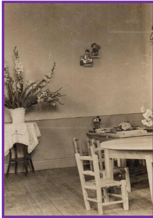
Vista de la sala del Jardín de Infantes