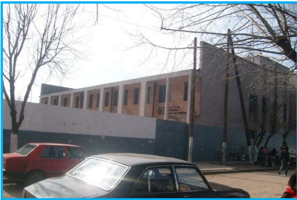
Edificio Escolar de la Escuela Primaria N° 20