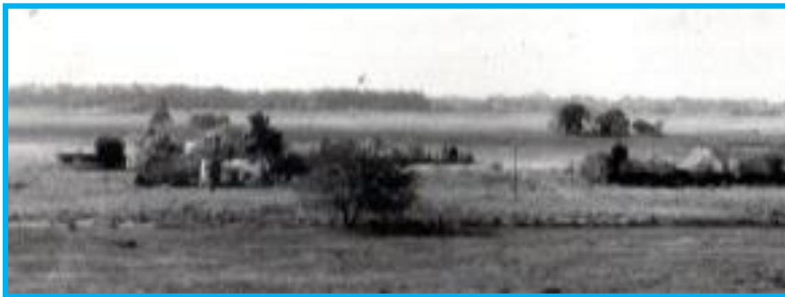
Vista del Barrio “Vucetich”

El Ferrocarril Urquiza brindaba algunos servicios diariamente, el tren de “pasajeros”, desde Federico Lacroze hasta Rojas y viceversa; y “el lechero” que transportaba la producción diaria hasta Villa Lynch, tren al que paraban con antorchas colocadas al costado de la vía. También pasaban sin detenerse los trenes hacia la Mesopotamia. Cuando comenzó a funcionar por el Camino a Roosevelt el transporte de colectivos “Nuestra Señora María Bistrica”, se dejó de utilizar el tren.