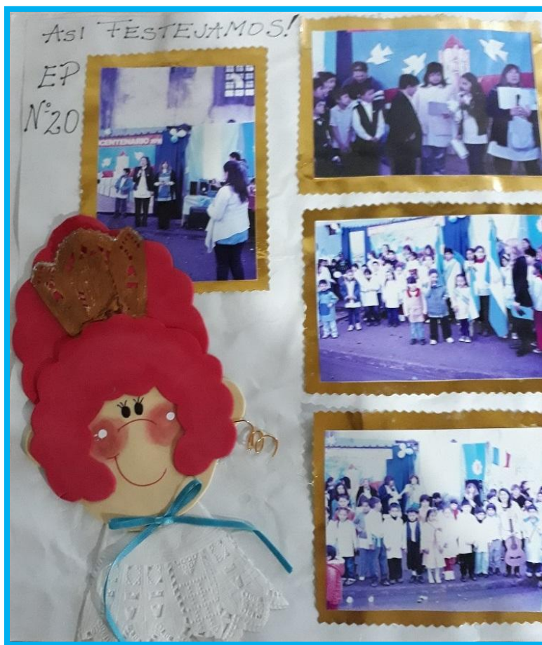
Así festejó la EP N° 20 el Bicentenario de la Revolución de Mayo

Un nuevo cambio se producirá en el 2005 cuando se creó la Escuela de Enseñanza Secundaria Básica N° 12, pasando a dicha escuela 7º, 8º y 9º año de la E.G.B., quedando la Escuela Primaria N° 20 con 1º a 6º año.