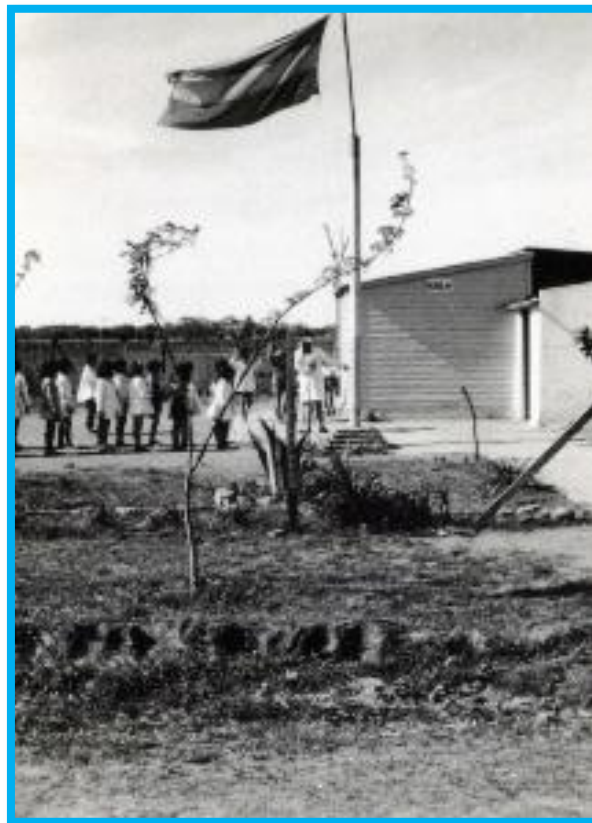
La Escuela N° 67 de General Sarmiento, actual Escuela Primaria N° 20 de José C. Paz, en sus comienzos

Avanzado marzo de 1966 comenzaron las clases en la Escuela N° 67 de General Sarmiento, actual Escuela N° 20 de José C. Paz, con 22 alumnos inscriptos, inaugurándose oficialmente el 9 de julio de ese mismo año.