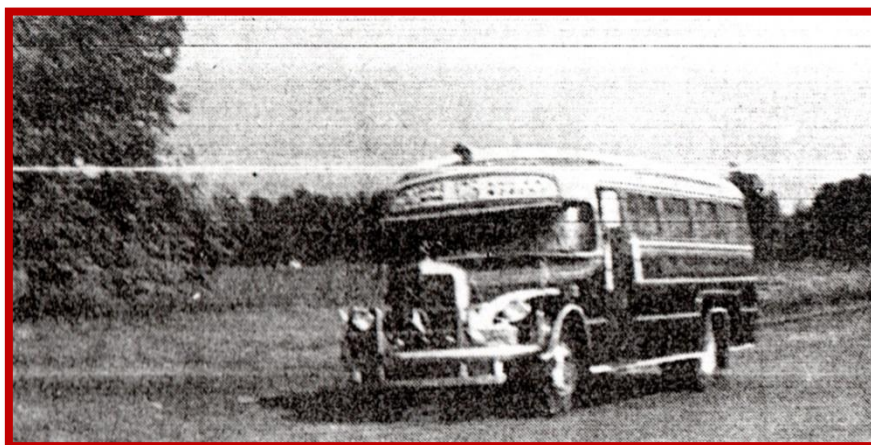
Colectivo de la Línea Nº 175, actual Nº 365, circulando entre el Barrio “El Triángulo” y el Campo de los sucesores de Blas País.