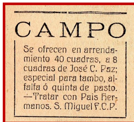
Aviso publicado en “El Progreso” del 15 de abril de 1918