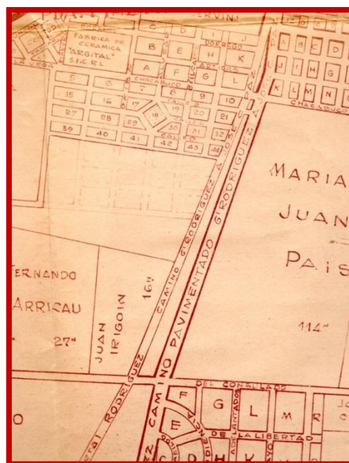
Plano donde se aprecia ambos caminos a General Rodríguez

En la década del cuarenta se había realizado un nuevo trazado del Camino a General Rodríguez, atravesando parte del campo de los País, formándose un triángulo de tierras entre ambos caminos, desde la actual calle Chacabuco hasta el Camino Roosevelt, actual Av. Croacia.