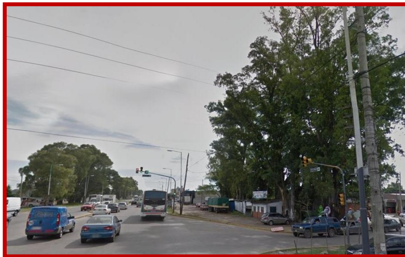
Ruta N° 24, Chacabuco y Potosí, vértice del Barrio “El Triángulo”

Entre los barrios “Altos de José C. Paz” y “San Gabriel”, quedaron 11 hectáreas donde continuó funcionando un tambo, hasta que en el año 2000 la Municipalidad de José C. Paz creó el “Mercado de Concentración Mayorista y Minorista de José C. Paz”, por medio de la Ordenanza N° 202/00 sancionada el 8 de agosto del 2000; promulgada por el Ejecutivo Municipal el 24 de agosto del 2000 por medio del decreto N° 0572/00, comenzando su construcción.