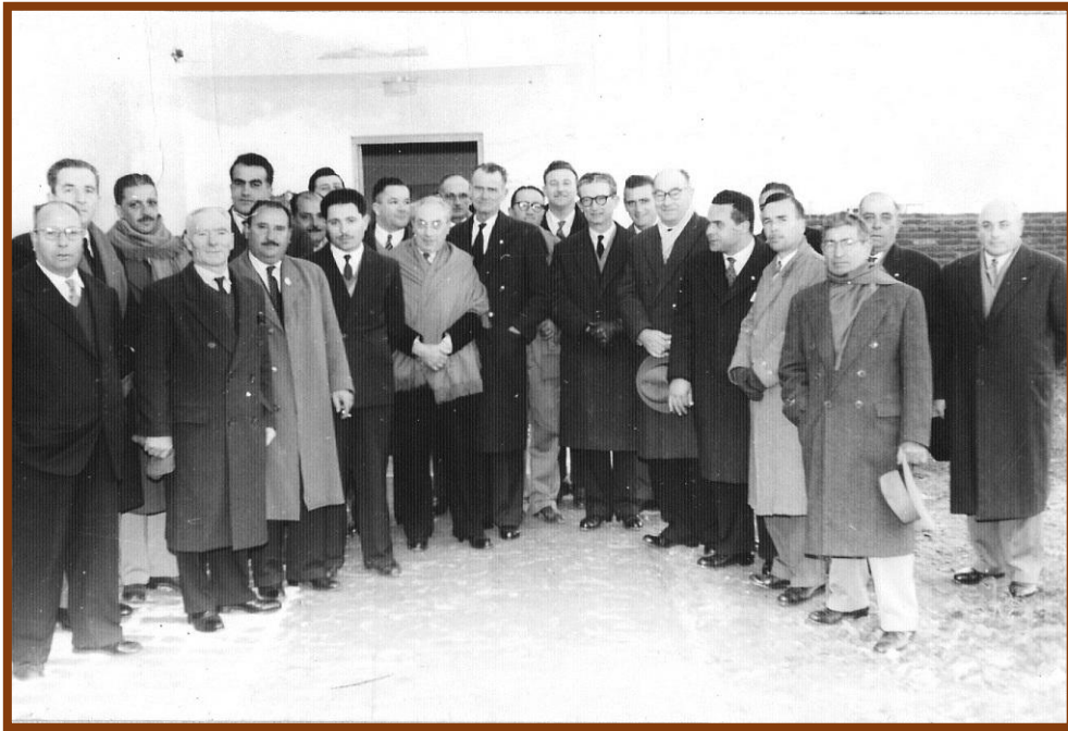
1959: Inauguración de la secretaría

En 1994, se produjo un triste acontecimiento, por razones totalmente ajenas a la Institución, la Sociedad Cosmopolita fue intervenida por el Gobierno de turno. Se suceden tres interventores, haciéndose algunas reformas edilicias que quedaron inconclusas. El capital acumulado por los socios desapareció como por arte de magia. La intervención cesó, las cuentas no son las de antes. Quedó un sabor amargo en muchos de los socios y ex integrantes de las comisiones directivas por la historia de los últimos años.