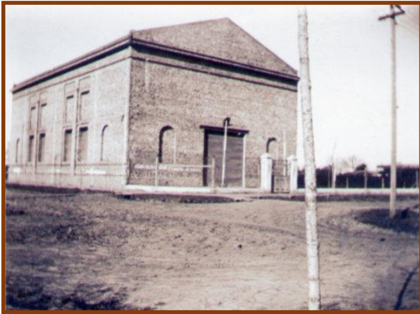
Salón Social de la Sociedad Cosmopolita