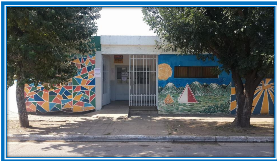
Escuela de Educación Secundaria N° 6 “Puerto Argentino”

Con la implementación de estas modificaciones, la E.E.M. N° 6, pasó a denominarse Escuela de Educación Secundaria N° 6, absorbiendo las Escuelas Secundarias Básicas N° 5 y 29, cursándose en seis años el nivel.