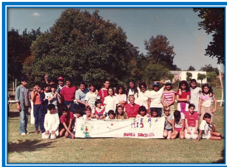
Egresados 1985 de la Escuela N° 86, actual EP N° 26

El 17 de marzo de 1980, abrió sus puertas la Escuela N° 86 de General Sarmiento, actual Escuela Primaria N° 26 de José C. Paz, con una sección de cada grado y un total de doscientos treinta y cuatro alumnos inscriptos.