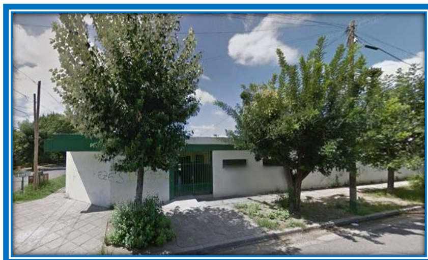
Escuela de Educación Secundaria N° 6 de José C. Paz ex Escuela de Educación Media N° 14 de General Sarmiento