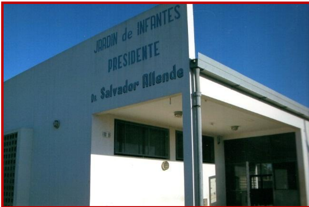
Jardín de Infantes “Dr. Salvador Allende”

Al llegar al lugar, se dirigieron primero al Jardín de Infantes para su inauguración, luego descubrieron la placa que recuerda el nombre de “Salvador Allende”, presidente de Chile, cuyo nombre fue impuesto al este nuevo establecimiento educativo; luego departieron con las docentes presentes sobre la importancia que tendrá el Jardín para la zona de influencia.