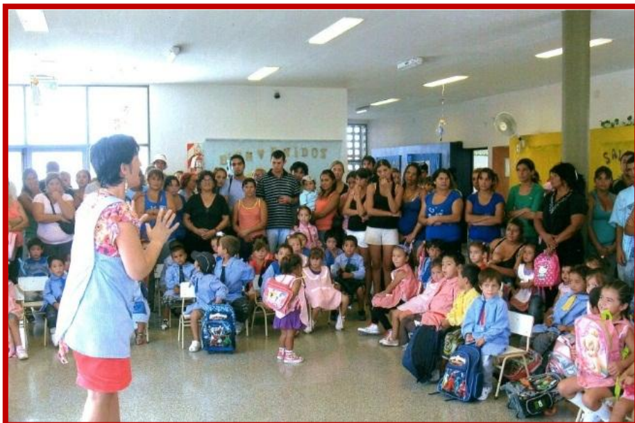
Inicio del ciclo lectivo en el 2010, Año del Bicentenario de la Revolución de Mayo”