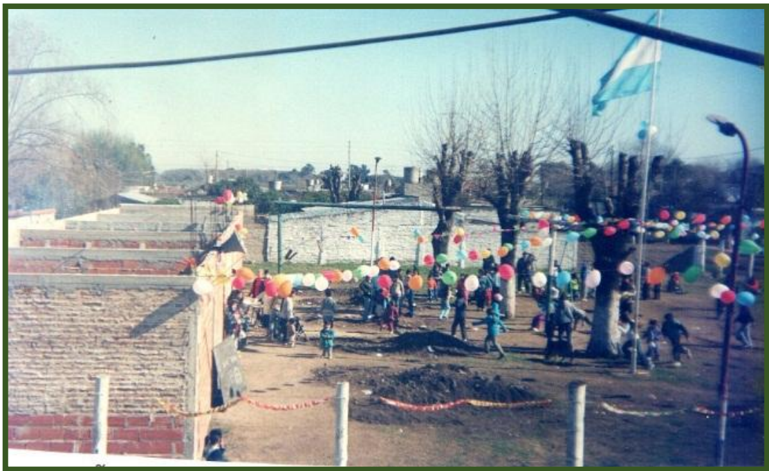
Festival del “Día del Niño” en el predio cercado y la construcción para el jardín maternal y la guardería ya iniciada

En el año 2001 la comisión vecinal logró cerrar el predio y se comenzó con la construcción de las primeras aulas.