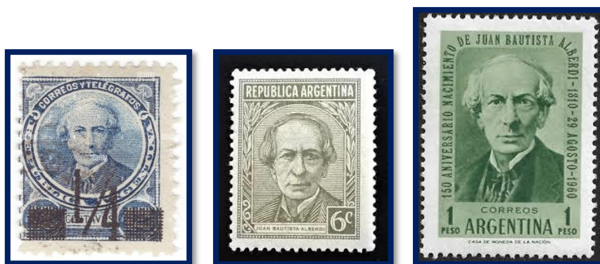
Sellos postales de “Juan Bautista Alberdi”

Regresó brevemente a Buenos Aires en 1878 cuando obtuvo una candidatura a diputado, pero se enfermó y volvió a Francia, donde murió el 19 de junio de 1884. Sus cenizas descansan en la casa de gobierno de Tucumán. Cada 29 de agosto se celebra en su honor, el Día del Abogado.