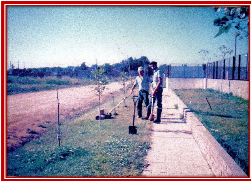
Integrantes de la Asociación Cooperadora cortando el césped

En 1999 con fondos de la Asociación Cooperadora se construyeron y colocaron las rejas perimetrales de todo el edificio, como resguardo de la seguridad edilicia. Ante los asiduos robos, la Cooperadora contrató un seguro contra robo y posteriormente un servicio de alarma monitoreada.