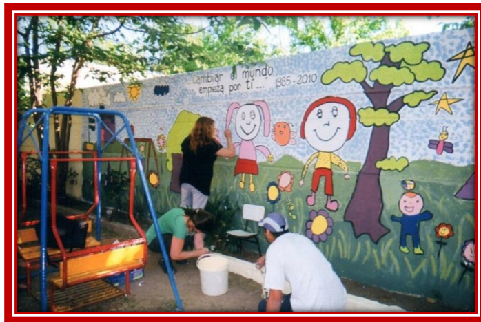
Ex alumnos pintando el mural en el patio del Jardín