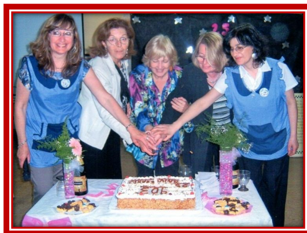
Directivos y ex directivos cortando la torta de los “25 años”