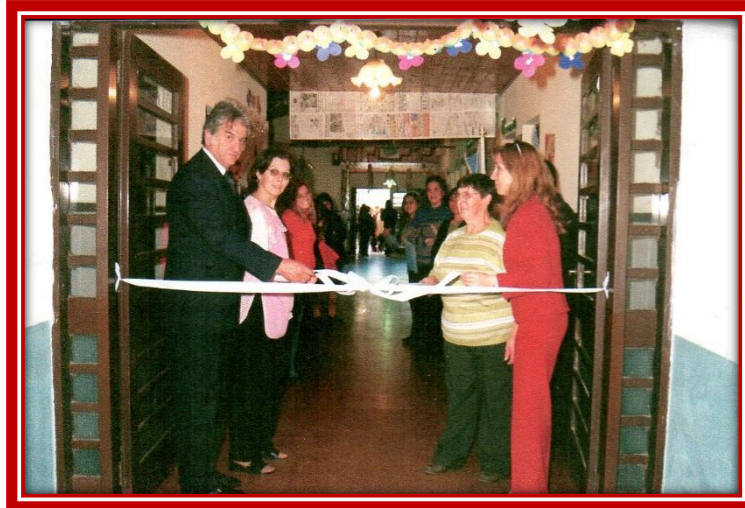
Inauguración de la Sala Verde

para la sala. Con la inauguración del aula el Jardín pasó a tener cinco salas por turno.