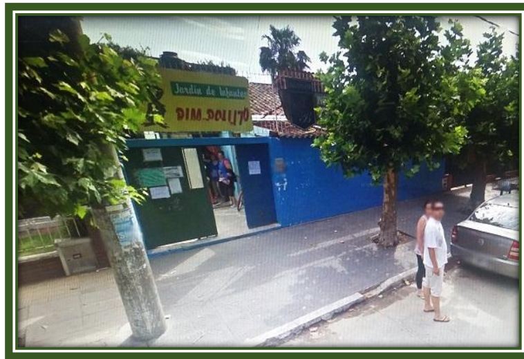
Portón de ingreso al Jardín de Infantes “Pim-Pollito”

El periódico Sucesos concluyó el artículo expresando: “Finalmente se debe destacar que las maestras residen en el barrio y que el Instituto Manuel Belgrano se encuentra en permanente expansión debido a la gran demanda de vacantes por parte de los padres” .