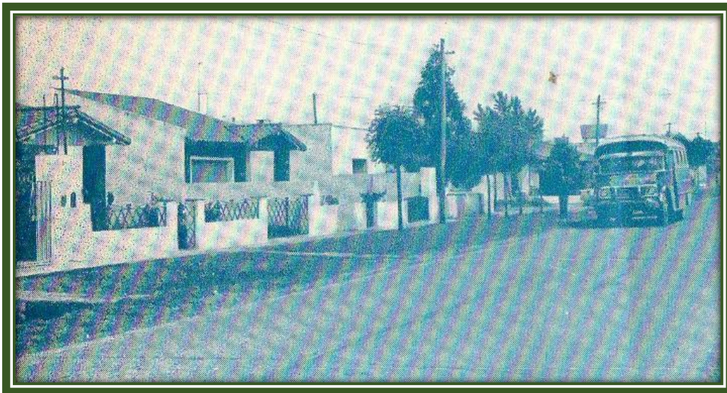
Chalecitos y casa americana ubicadas sobre Avenida Gaspar Campos (1967)

El barrio donde está ubicado el Instituto “Manuel Belgrano” surgió a partir de 1950, cuando la firma Infico S. R.L. loteó las manzanas comprendidas entre las actuales Avenida Gaspar Campos y las calles Tres Sargentos, Martín Rodríguez y Chile; nueve manzanas en total. Los compradores pudieron adquirir su terreno y construir sus casas por medio de créditos del Banco Hipotecario; las construcciones son muy similares, unos chalecitos tipo californianos y otras casas tipo americano. En la esquina de Miguel Cané y Avenida Gaspar Campos la Inmobiliaria construyó una galería comercial, donde se establecieron los primeros comercios del barrio. El barrio lleva el nombre de la Inmobiliaria.