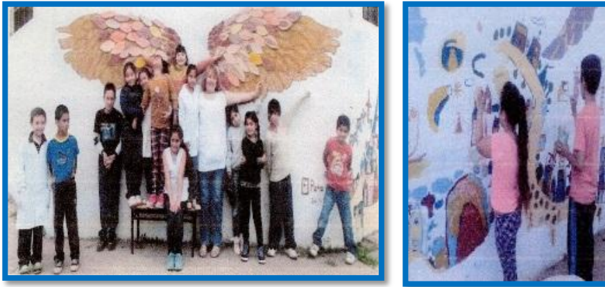
Mural “Alas para ir IV”

En el año 2018, partiendo de la realidad en que los días de lluvia eran desfavorables para la Escuela Primaria N° 34, ya que se inundaban las calles de acceso, los alumnos fueron motivados a ver que más allá de la adversidad se podían hacer cosas lindas, y así un lunes en que la calle estaba inundada por las lluvias del fin de semana, se pusieron a armar barquitos de papel y cartulina algunos con el mensaje “hoy nos divertimos pero cuando llueve mi escuela se inunda y no puedo llegar” , los que fueron botados en la calle Chile.. La actividad y problemática fue muy difundida logrando que dos días después, la municipalidad envió camiones para desagotar y limpiar la calle de la escuela y las de alrededores.