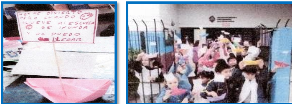
Barquito armado con mensaje y los alumnos saliendo a botar los barquitos

En el año 2018, partiendo de la realidad en que los días de lluvia eran desfavorables para la Escuela Primaria N° 34, ya que se inundaban las calles de acceso, los alumnos fueron motivados a ver que más allá de la adversidad se podían hacer cosas lindas, y así un lunes en que la calle estaba inundada por las lluvias del fin de semana, se pusieron a armar barquitos de papel y cartulina algunos con el mensaje “hoy nos divertimos pero cuando llueve mi escuela se inunda y no puedo llegar” , los que fueron botados en la calle Chile.. La actividad y problemática fue muy difundida logrando que dos días después, la municipalidad envió camiones para desagotar y limpiar la calle de la escuela y las de alrededores.