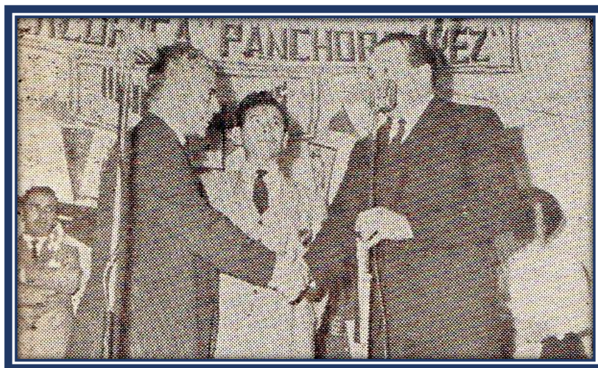
Sexto aniversario de la Peña “Pancho Ramírez”