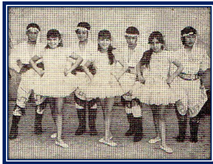
Grupo de alumnos de la Peña “Pancho Ramírez”

La Peña Pancho Ramírez en 1972 tuvo un periodo brillante, además de las presentaciones regulares realizadas en el Club, se destacó en el transcurso de la Fiesta del Niño Pampeano, realizada ese año en Quemú Quemú, provincia de La Pampa, evento transmitido por radio y televisión a todo el país.