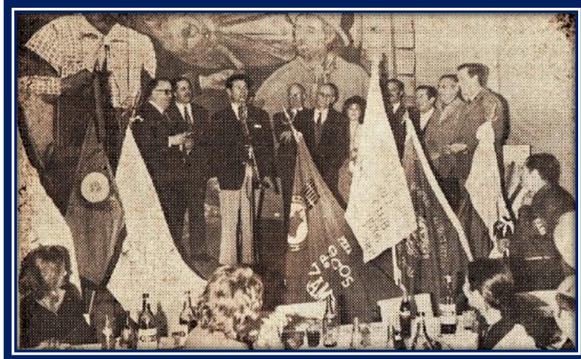
Tercer aniversario de la federación de Peñas de General Sarmiento

El 25 de julio de 1971, la Federación de Peñas celebró con una grata comida de camaradería su tercer año de vida. Aproximadamente 250 personas se dieron cita a fin de hermanarse con los hombres que guían a la Federación de Peñas y celebrar el aniversario con un rico loco 6 .