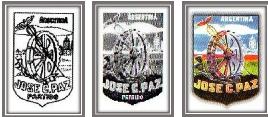
Desde 1995 hasta 2016 la Municipalidad utilizó distintos diseños del Escudo Oficial

varios de mayor tamaño que fueron emplazados en los jardines del Palacio Municipal, del Centro Educativo Municipal (CEM), en la Plaza Juan Pennacca, en la Plaza del Ferrocarril y en el primer edificio de Hospital Oftalmológico y Odontológico, entre otros. También se colocó otro en el Paseo de la Independencia emplazado en el boulevard central de la Avenida Potosí, boulevard que fue suprimido últimamente por ensanche de la avenida.