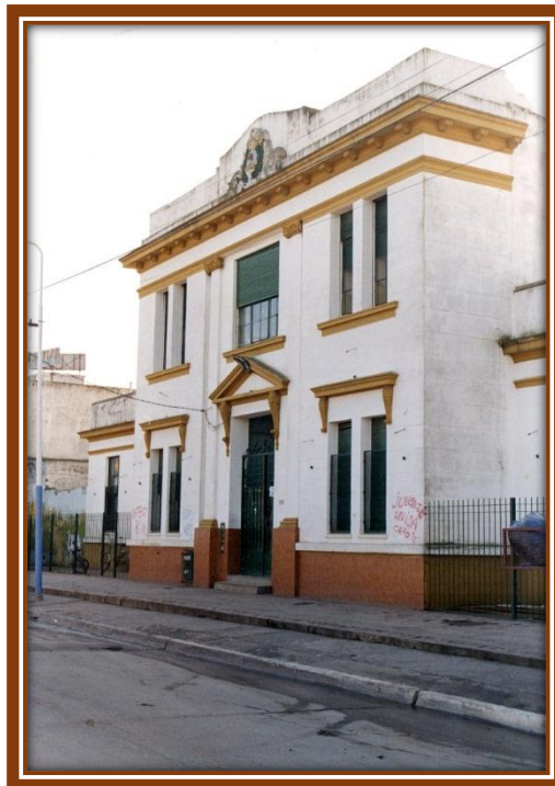
Escuela Nº 5, actual Escuela Primaria Nº 2

cubriría el cargo de secretaria, y yo, María Amalia Sanguinetti, designada preceptora. Convocamos alumnos durante los meses de enero y febrero que habiendo fracasado en los exámenes de ingreso, que por aquellos años se tomaban; no podían cursar la enseñanza secundaria, también se buscaron alumnos repetidores de primer año 3 .