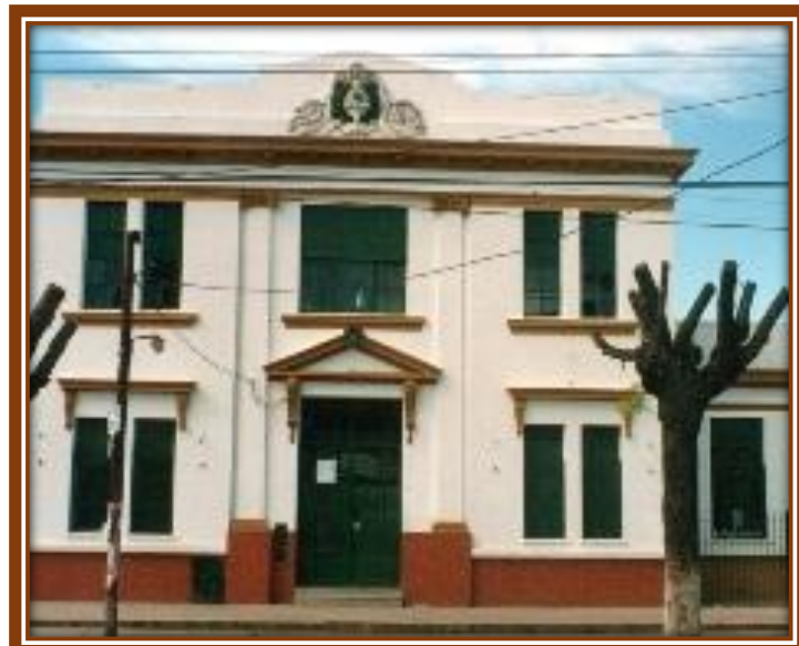
En la planta alta del edificio escolar funcionaban “los talleres”

Cuando todo estuvo en orden, ubicaron los talleres de radio, de televisión, de mecanografía y la biblioteca fundada por la que suscribe. Actualmente en ese primer piso funciona la Jefatura Distrital de Educación”.