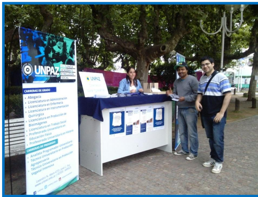
2014: Stand de la UNPAZ en la Plaza de José C. Paz con la oferta académica en el encuentro Distrital de Escuelas

El 3 de abril de 2012, 1688 alumnos comenzaron a cursar el primer año de las seis carreras que se dictaban en la UNPAZ: Abogacía, Licenciatura en Enfermería, Licenciatura en Administración, Licenciatura en Trabajo Social, Profesorado de Educación Física y Analista Programador Universitario.