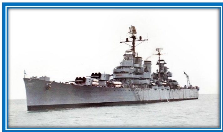
Crucero ARA “General Belgrano”

El buque tenía cobertizo para seis aviones, con dos catapultas. Su armamento convencional era de 15 cañones montados en torres triples giratorias; 8 cañones de doble propósito; 28 cañones antiaéreos en montajes cuádruples; 26 cañones antiaéreos en montajes dobles y varias ametralladoras. A fines de 1968, luego de sucesivos reacondicionamientos, se le colocaron rampas para el disparo de misiles. Su tripulación era de 1000 hombres en tiempos de paz, que podría ser sensiblemente reforzada.