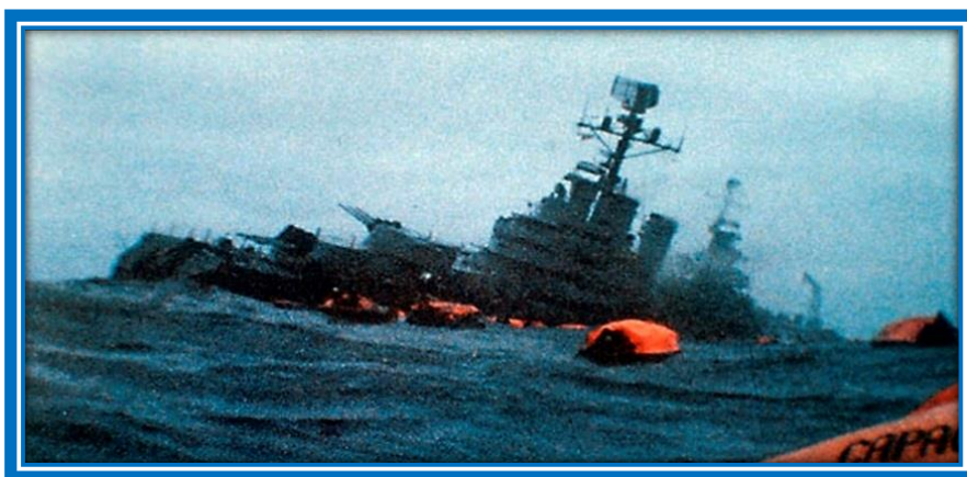
Hundimiento del Crucero ARA General Belgrano