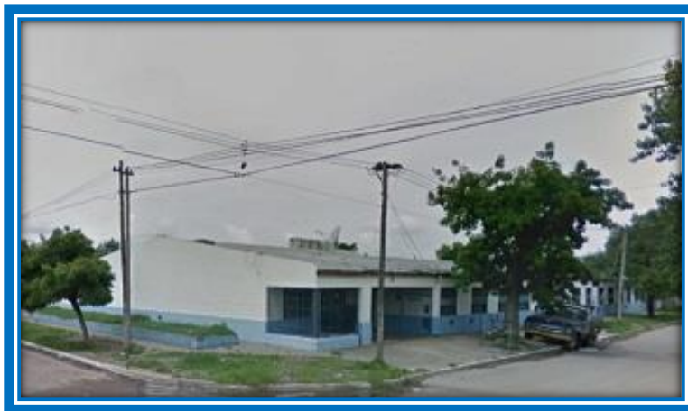
Escuela N° 92 de General Sarmiento

Terminados ambos edificios, fueron inaugurados por el gobernador Jorge R. Aguado el 25 de febrero de 1983. Debido a necesidades edilicias de la Escuela N° 52, actual Escuela Primaria N° 11, ubicada en la calle Las Delicias y Provincias Unidas, actual César Malnatti, se la trasladó provisoriamente al edificio destinado para escuela secundaria, ubicado en Mendoza y Tres Sargentos, hasta tanto se edifique el nuevo edificio en su emplazamiento de origen.