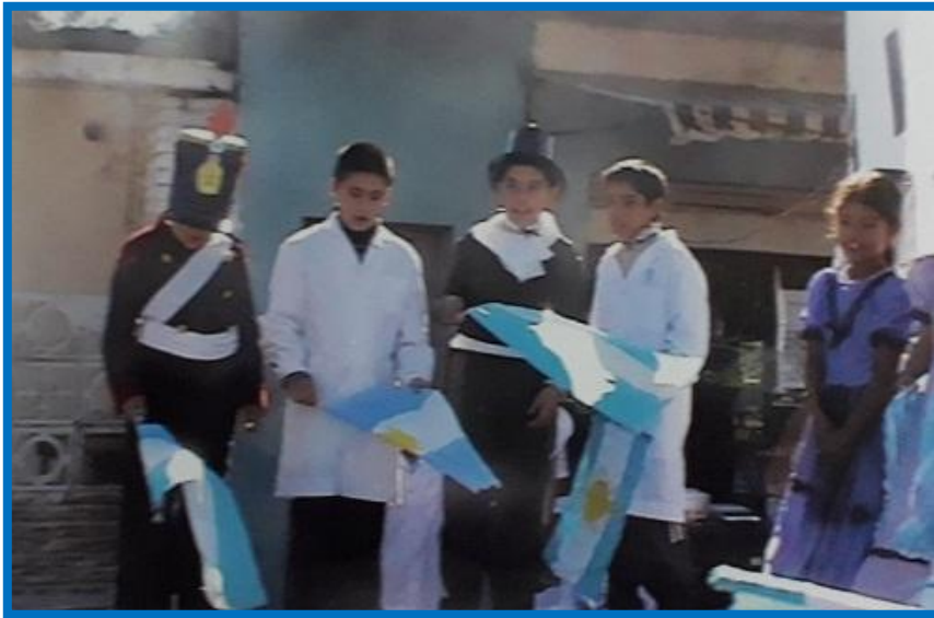
9 de julio de 2007: Fotografías con historia en el día que nevó en el Gran Buenos Aires