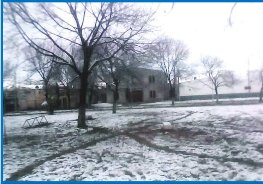
La plaza de Altos de José C. Paz bajo el manto blanco de la nieve, detrás la Capilla Nuestra Señora de Guadalupe y la Escuela Nº 28 6