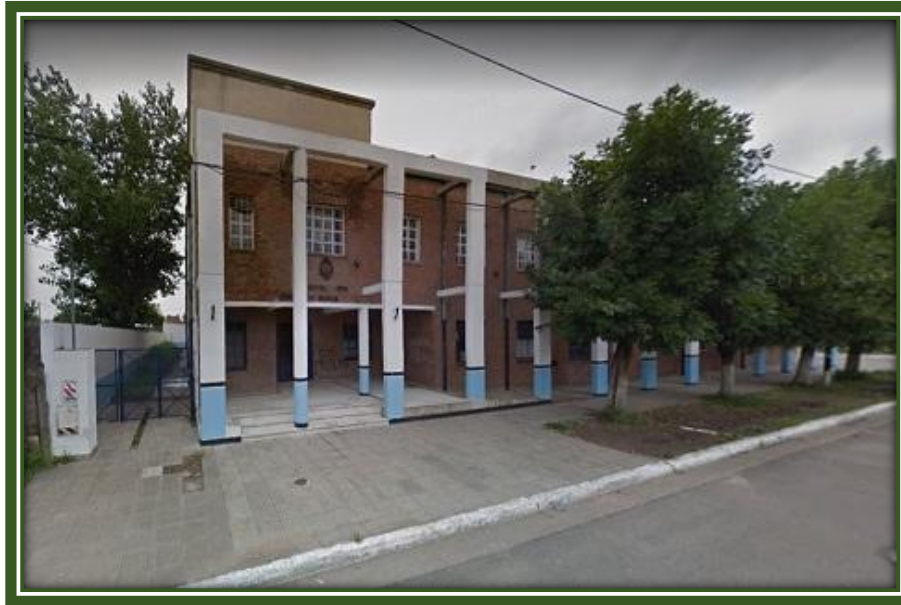
Frente Escuela Primaria N° 16 sobre calle Miller