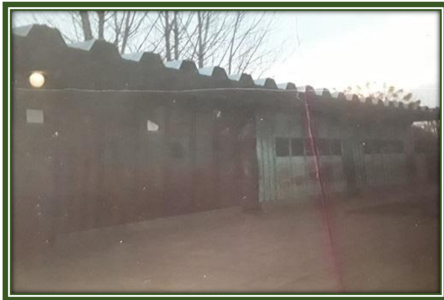
Primer edificio de la Escuela N° 61, actual Escuela Primaria N° 16

La escuela estaba construida en chapa y “a un nivel más bajo que la calle. Los baños de los alumnos (estaban) separados por la cocina y los depósitos de agua estaban dentro de la cocina. Los días de lluvia se inundaban los patios y las aulas, su instalación eléctrica presentó deficiencias, teniendo algunas aulas electricidad” 3 .