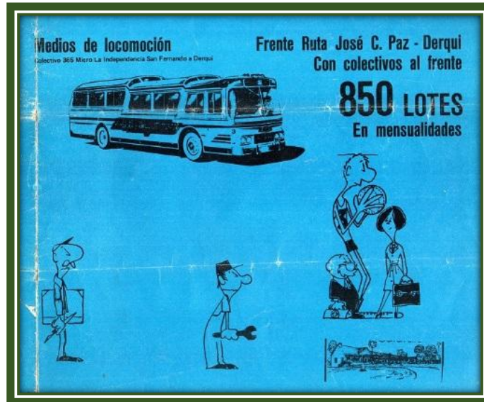
Parte del folleto del primer loteo

manzanas y 12 medias manzanas. En esta segunda fracción, la manzana N° 209, delimitada por las calles Miller, San Blas, Nueva Granada y San Salvador, está señalizada como “plaza”, y frente sobre la calle San Blas, entre Miller y Nueva Granada, la mitad de la manzana N° 208 está señalizada como “reserva fiscal”.