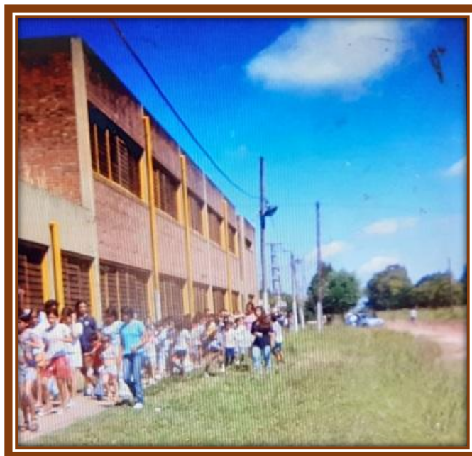
Alumnos de la EGB N° 12 de José C. Paz