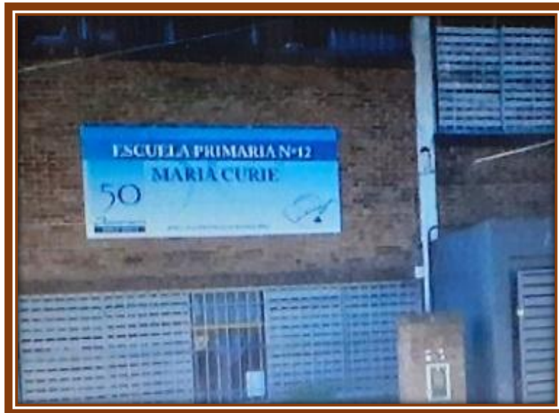
1963 – 2013: 50° Aniversario de la EP N° 12, ex Escuela N° 55 de General Sarmiento

En mayo de 2013, al celebrar las Bodas de Oro, el equipo directivo de la EP N° 12 estaba conformado por Silvia Cervela y Griselda Pasos.