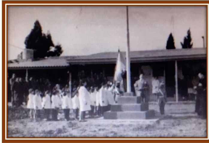
Izamiento de la Enseña Nacional el 5 de mayo de 1963

El acto comenzó con palabras de bienvenida a cargo de la directora de la Escuela N° 55, después se enarboló por primera vez la Enseña Nacional en el mástil construido al efecto, a continuación se entonó el Himno Nacional, terminado el padre Lorenzo van der Sanden bendijo las instalaciones, siguieron los discursos, y por último las autoridades y los mayores recorrieron la escuela, mientras los chicos de las establecimientos escolares vecinos, volvimos con nuestra maestra para la escuela, con un turrón de regalo que saboreamos por el camino. Fue un día frío, pero muy soleado, con un cielo teñido de celeste intenso.