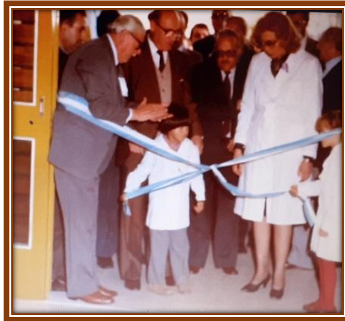
El gobernador Jorge Aguado, la directora Ana María Fernández de Marcogiuseppe y alumnos de la Escuela N° 55 cortando las cintas

Con la vuelta de la democracia, en 1984 se reabrió la Universidad Nacional de Luján y en 1985 su Centro Regional de General Sarmiento comenzó a funcionar en el turno vespertino en las instalaciones de la Escuela N° 55, actual EP N° 12.