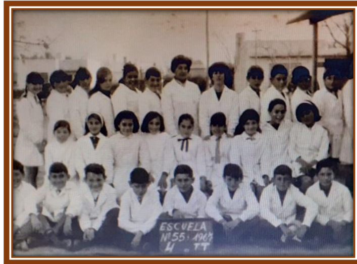
Alumnos de 4° grado

Cristina Sista. En 1970 dado el crecimiento que se venía dando en los grados inferiores, se creó un segundo séptimo con un total de 58 alumnos entre las dos secciones; en 1971 se volvió a un solo séptimo con 33 alumnos.