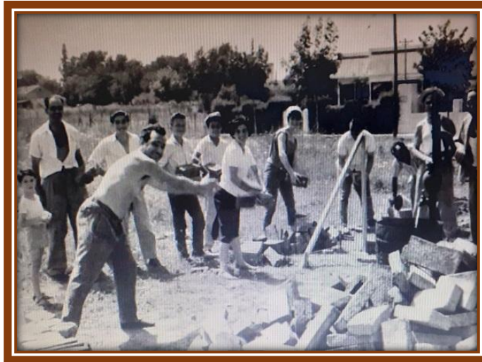
La comunidad trabajando por el crecimiento edilicio de la Escuela