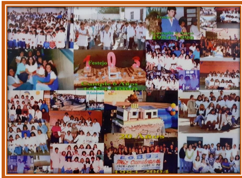
Aniversarios de la Escuela N° 103 – EGB N° 33