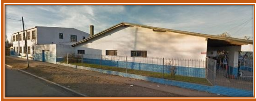
EGB N° 33 vista desde la calle Castañeda apreciándose las nuevas aulas

Sarmiento pasó a denominarse EGB (Enseñanza General Básica) N° 33 de José C. Paz. Dado que la matrícula escolar continuó su aumento año a año llegando a casi a 2000 alumnos en este año, se construyeron ocho aulas más.