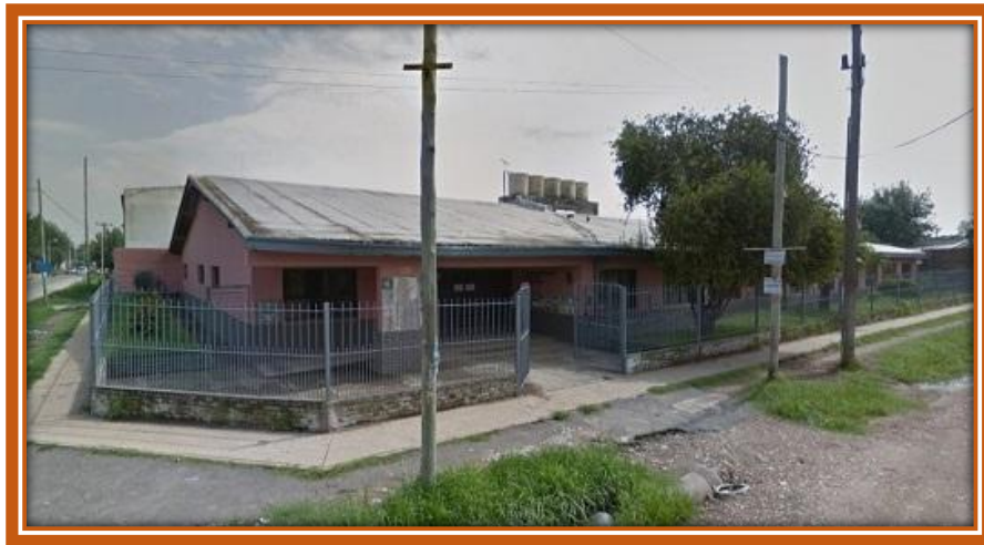
Escuela Primaria N° 33, ex Escuela N° 103 de General Sarmiento

once secciones de grado, provenientes de las escuelas vecinas N° 67, actual EP N° 20, de barrio Vucetich; N° 97, actual EP N° 30 del Barrio La Paz; N° 70, actual EP N° 21 del Barrio Frino y N° 32, actual EP N° 6 del Barrio Alberdi. Finalizó el año escolar con 585 alumnos, de los cuales 22 terminaron su ciclo primario en 7° grado.