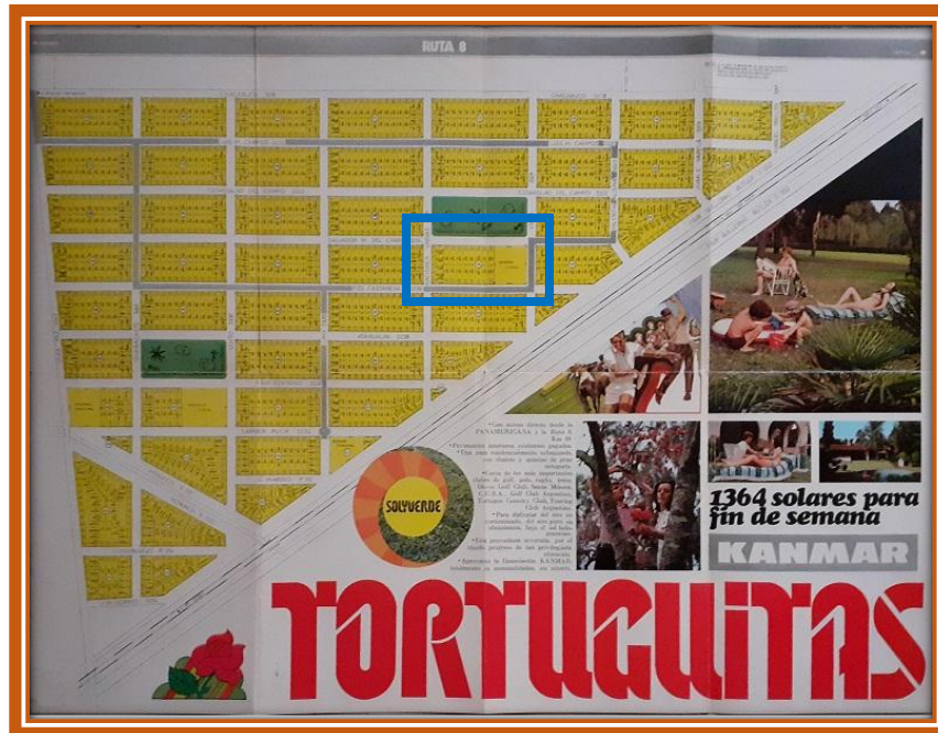
Mapa del loteo, remarcado en celeste la manzana N° 196 donde está ubicado el “Predio Fiscal” destinado para la Escuela

Castañeda, Naciones Unidas y Salvador María del Carril, había una parcela destinada como “reserva fiscal”, con una superficie de 54 metros de frente por 48,06 metros de fondo, equivalente a 12 terrenos de la manzana. El dominio de este predio fiscal fue transferido por la Municipalidad de General Sarmiento, mediante la Resolución N° 19053, a la Dirección General de Cultura y Educación para la edificación de un establecimiento escolar.