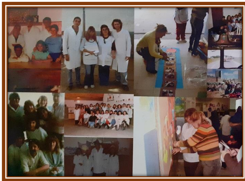
Maestros de todos los tiempos