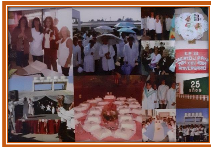
1984 – 2009: Celebración de las Bodas de Plata

Al implementarse la última Ley de Educación Nacional, la N° 26.206 y la Provincial N° 13.688, la E.P.B. N° 33 comenzó a denominarse Escuela Primaria (EP) N° 33 con seis años de escolaridad y la E.S.B. N° 19 incrementó tres años conformándose la Escuela de Educación Secundaria (EES) N° 24, también con seis años de escolaridad.