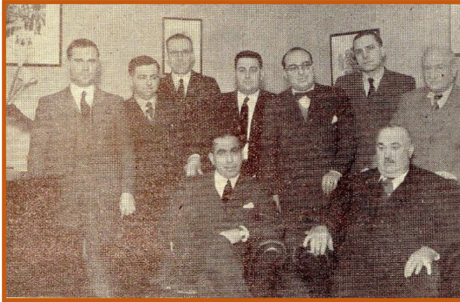
Comisión Directiva de la Unión Vecinal

Varios vecinos interesados se acercaron a “El Progreso” para preguntar: ¿Qué es la Unión Vecinal? En el mismo número el periódico daba respuesta: “La Unión Vecinal tiende a agrupar en su seno a todos los vecinos sin distinción de credos ni colores políticos; miembros del comercio y de la industria y delegados de las entidades sociales y deportivas, para que todos hagan de su parte lo que le sea posible para contribuir al progreso de José C. Paz en todos sus aspectos” .