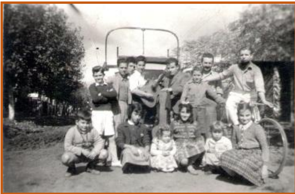
Calle Rivadavia “la colorada” de Villa Iglesia

Ante esta realidad, decía La Prensa: “Las autoridades municipales de General Sarmiento parecieran ignorar todo esto, o, en caso contrario, no tomar en cuenta para nada la situación anómala que denunciamos” .