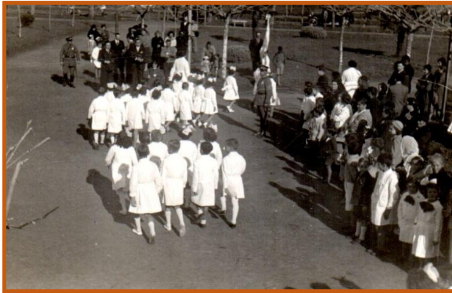
Delegaciones escolares en el acto del 9 de Julio de 1939