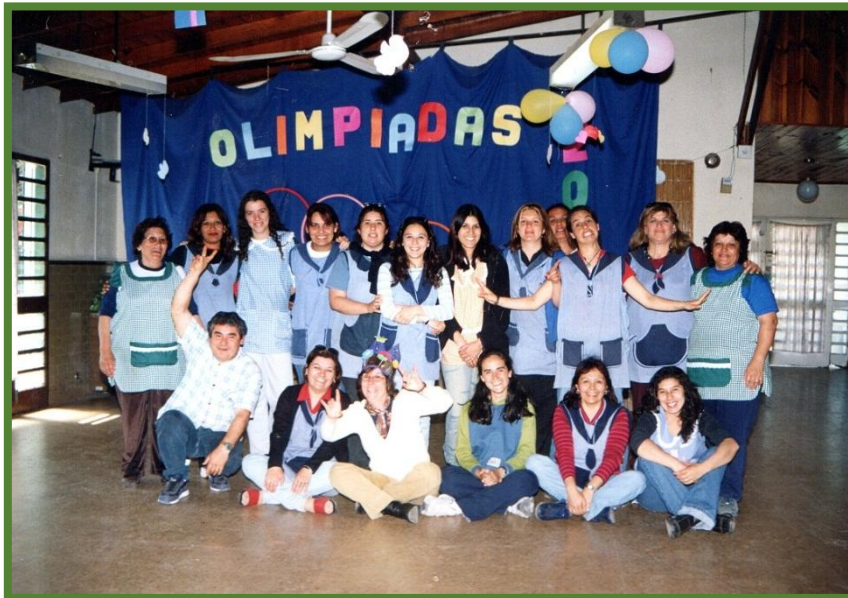
Personal del Jardín de Infantes Nº 902

“Las efemérides patrias en el marco del Bicentenario”. Sobresalieron las participaciones en olimpiadas de lectura con la comunidad, como en los actos patrios revalorizando el conocimiento de nuestra historia a partir de una mirada integradora desde las ciencias sociales.