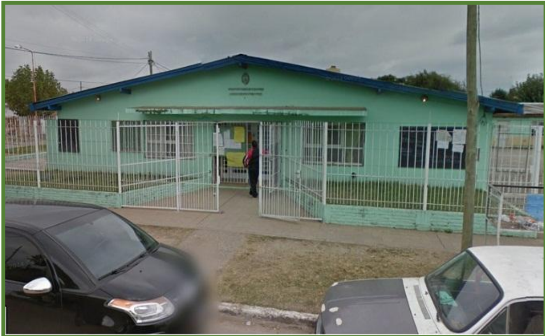
Jardín de Infantes N° 902 “Alfonsina Storni” ex Jardín de Infantes N° 915 de General Sarmiento