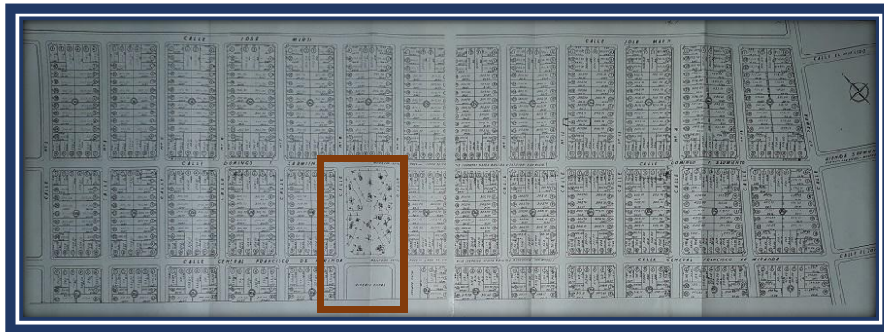
Plano de loteo del Barrio Sarmiento aprobado en 1957 1