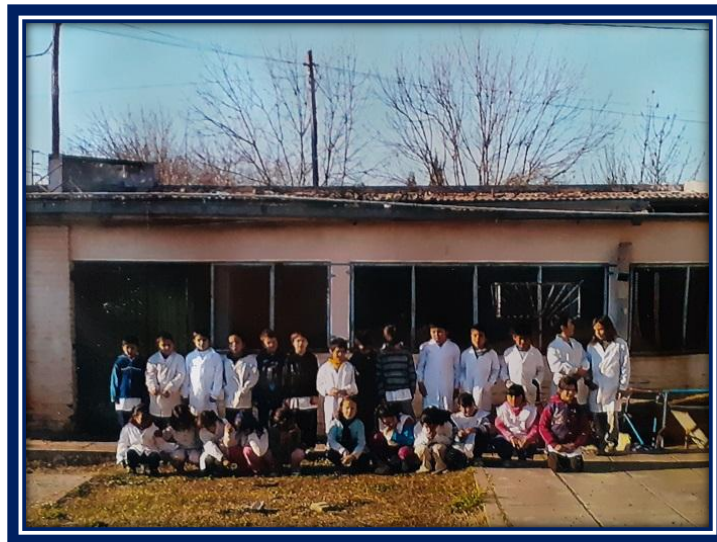
Alumnos delante del antiguo edificio escolar

En 1995 fue el último año que se cursó la escuela primaria en siete grados, finalizando el año con una matrícula de 918 alumnos, de los cuales 133 culminaron su primer grado, 166 su 2° grado, 159 su 3° grado, 129 su 4° su grado, 123 su 5° grado, 118 su 6° grado y 90 su 7° grado culminado estos su escolaridad primaria.