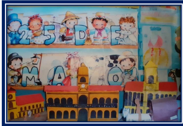
Trabajo de los alumnos de 1° Ciclo