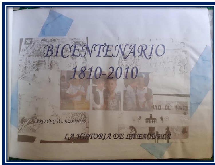
Portada con los trabajos realizados en la EP Nº 15 en el Álbum Distrital del Bicentenario