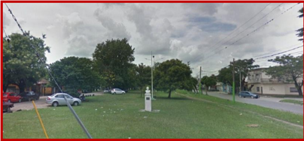
Plaza y Avenida “Dr. René Favaloro”

Presentamos la biografía del Doctor René Favaloro 2 :