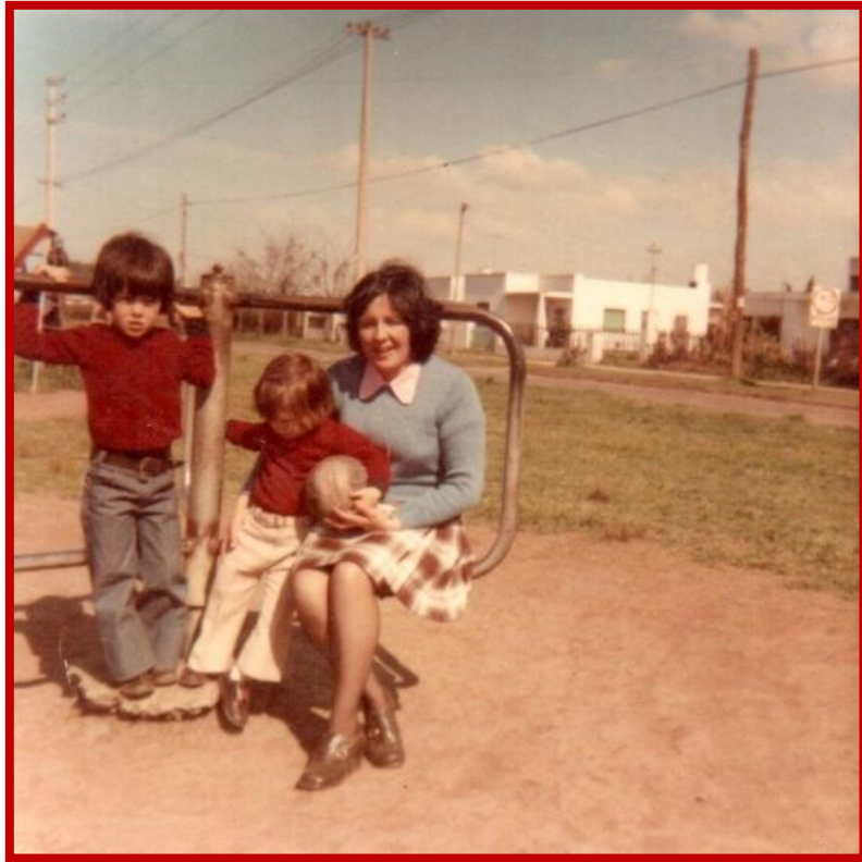
Parque Infantil en la década del setenta detrás, de tierra, la calle Muñoz

Gallardo y Muñoz, abriéndose esta última calle desde Pueyrredón hasta la Ruta Nacional N° 197.