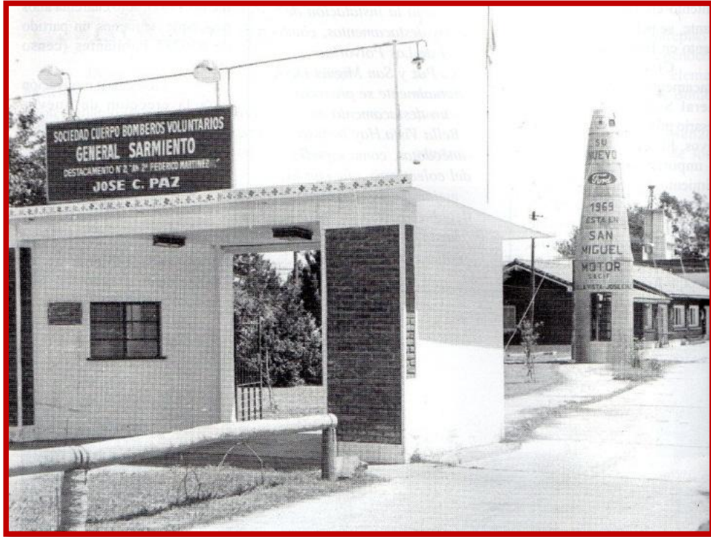
Destacamento Nº 2 “Ayudante Federico Martínez”