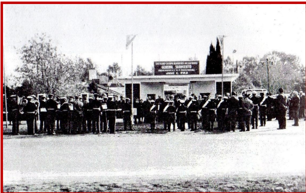
Inauguración del Destacamento Nº 2 “Ayudante Federico Martínez”

“21 de mayo, 10,30 horas: Inauguración y bendición de las instituciones del Destacamento Nº 2 Ayudante Federico Martínez, en el inmueble que fuera donado por la Ex Asociación El Cruce, en la intersección de las Rutas 197 y 8 de la ciudad de José C. Paz”. 1