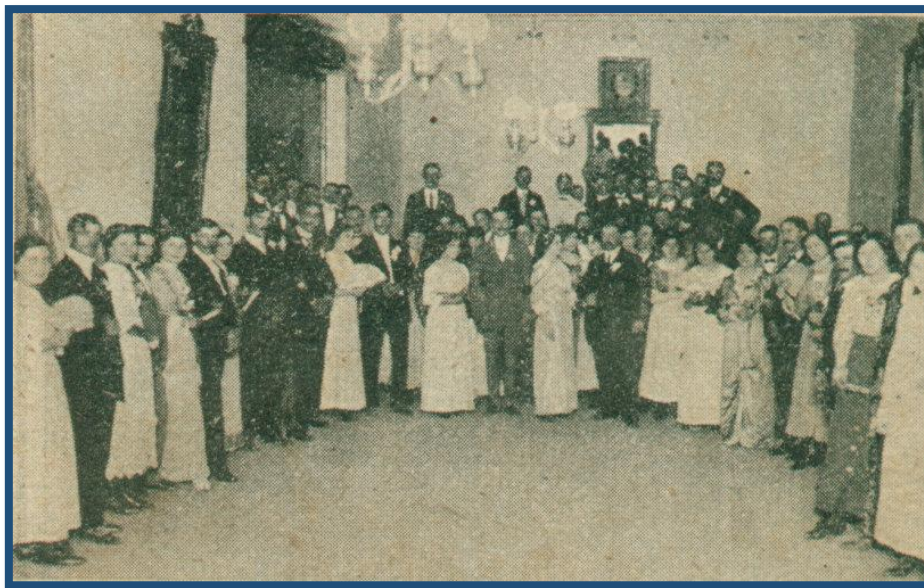
Baile familiar en el Centro Recreativo Juventud de Artesanos

Así el Centro Recreativo, año tras año, fue cumpliendo el objetivo de recrear a sus asociados, un mes un baile familiar, otro una representación del cuadro teatral, también fueron asiduos los picnics en los campos de los alrededores agasajando a un socio por su casamiento, o los familiares al río Reconquista o al arroyo Pinazo, también al Tigre.