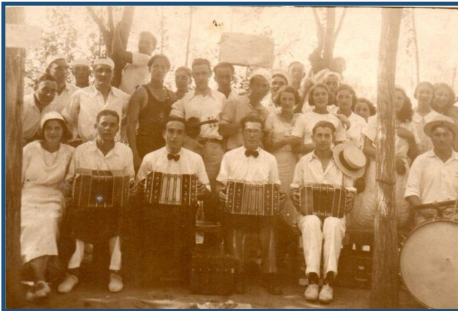
Picnic en el Tigre amenizado con orquesta