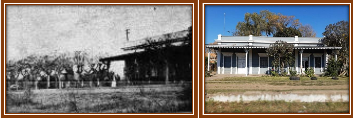
Estación Piñero en 1950 y en 2020 5

El Tranway Rural de Federico Lacroze, ya con el Nombre de Ferrocarril Central Buenos Aires, el 1º de diciembre de 1906 habilitó una segunda estación dentro del actual partido de José C. Paz, la Parada “Altimpergher”, ubicada en el cruce de las vías con el camino de San Fernando a Rodríguez (actual Avenida Hipólito Yrigoyen, o Ruta Nacional Nº 197 o Ruta Provincial Nº 24).