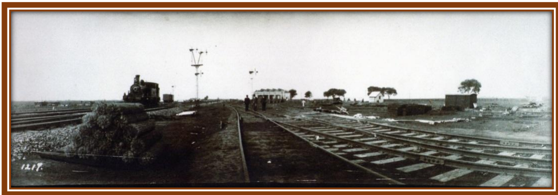
Tendido de vías y construcción del galpón de máquinas