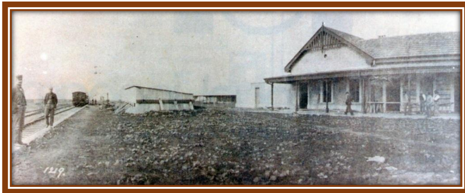
Estación de Arroyo Pinazo, después José C. Paz, en construcción