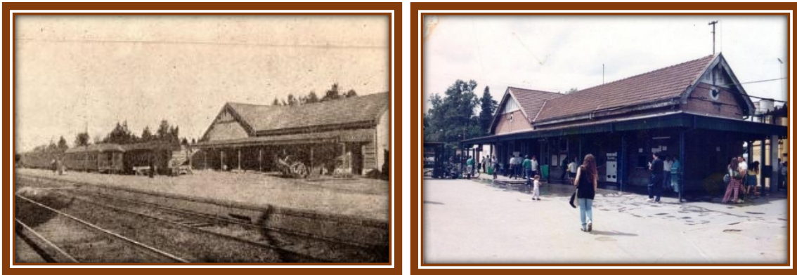
Estación José C. Paz en 1937 y en 1997