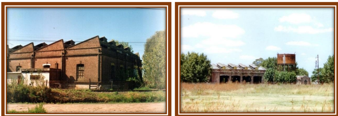
Galpón de Máquinas en 1997, visto desde la calle Fraga Y en el 2000, visto desde el terreno ferroviario o “campo de la estación”