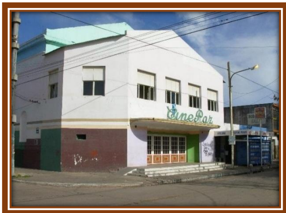
Ex Cine Paz, Salón de la Sociedad Cosmopolita José Altube de Socorros de José C. Paz en 1930 y en 2010