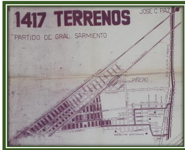
Plano de ubicación del loteo “Ampliación barrio La Paz”

que fueron subdivididas en 10 manzanas y 3 fracciones de manzana, mediante plano 48-37-1956 aprobado por la Dirección de Geodesia y Catastro de la Provincia de Buenos Aires, delimitadas por las actuales calles Fray Butler, Chacabuco, Federico Lacroze y la mitad de manzana entre Estocolmo y Oslo, fraccionamiento que en el uso corriente lo dominaron Barrio “Peralta”, por un comercio de la zona.