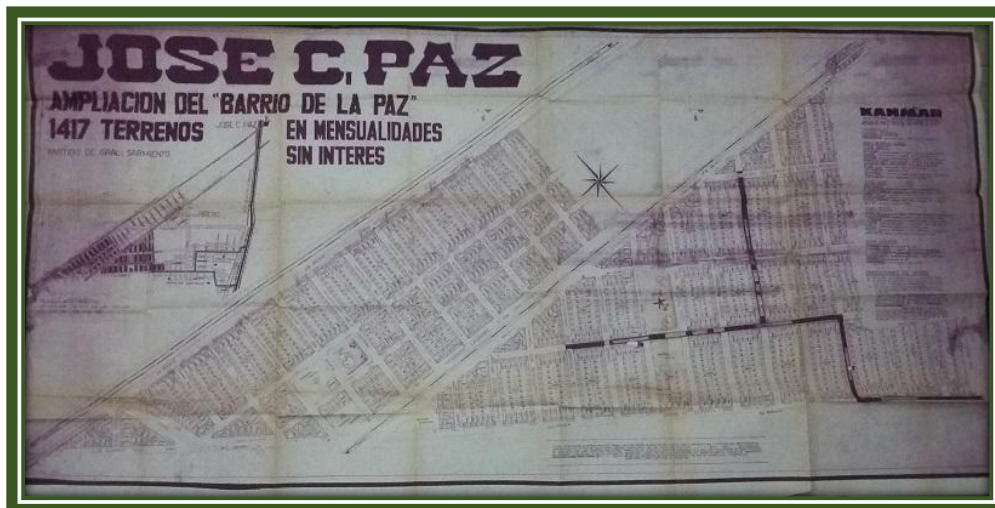
Plano de loteo, a la izquierda Barrio Sagrada Familia (entre la vías de ambos ferrocarriles), a la derecha Barrio La Paz (de forma triangular)