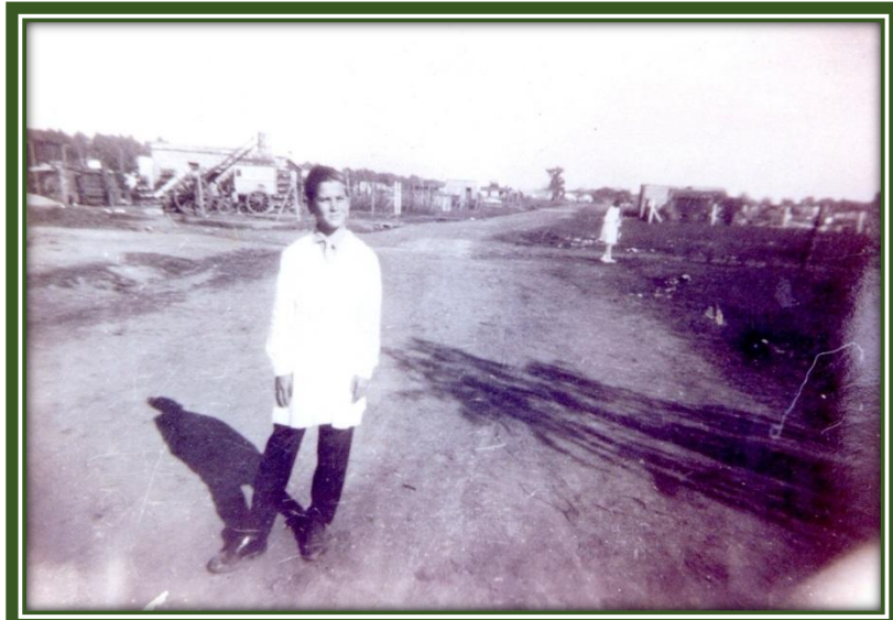
Calle Chacabuco, uno de los accesos al barrio La Paz

Un loteo, dos barrios, que pronto tendrán accesos distintos, mientras que a La Paz se ingresaba por Gorriti o por Chacabuco y después se costeaba la vía del Urquiza, a Sagrada Familia, lo hacían por Butler costeando la vía del San Martín, y al pasar la curva de “Peralta”, tomaban Uspallata.