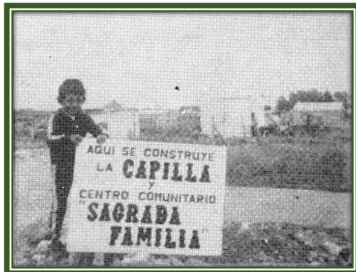
Vista del barrio desde el terreno donde se iba a construir la Capilla