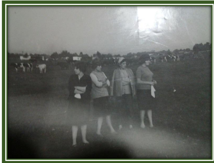
Vista del barrio Sagrada Familia en sus comienzos