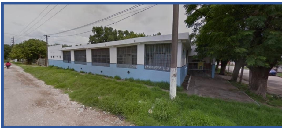
Escuela Primaria N° 18