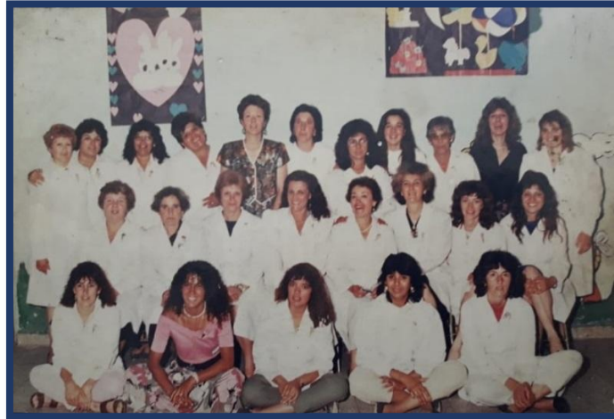
1990: Directivos, docentes y ex docentes celebrando los 25 años de la Escuela N° 64 de General Sarmiento