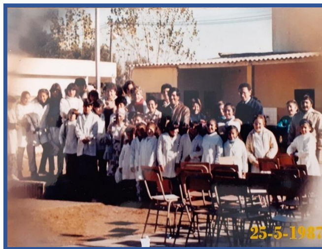
25 de mayo de 1987: La Comunidad Escolar celebrando el “22” aniversario de la Escuela