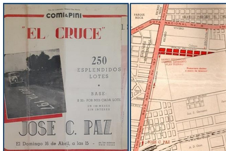
Folleto y ubicación del loteo realizado por Comi & Pini en 1950