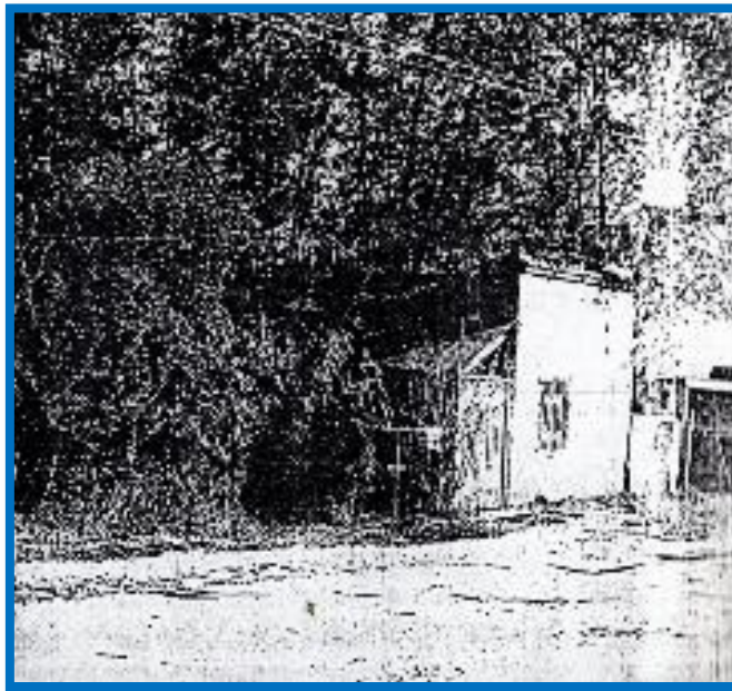
Primer edificio de la Escuela Primaria N° 4, entonces N° 29

El 14 de noviembre de 1959, se realizó el acto de imposición del nombre “Doctor Guillermo Rawson”, en homenaje al médico, político y docente sanjuanino, a la Escuela Primaria N° 4 de José C. Paz, entonces Escuela N° 29 de General Sarmiento, del Barrio Las Acacias.