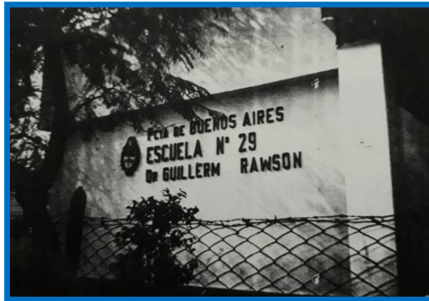
Frente del edificio escolar, entonces Escuela N° 29, inaugurado en 1964