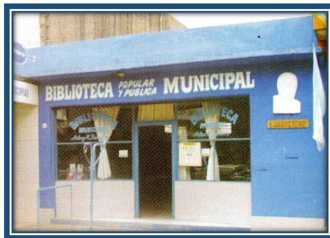
Biblioteca Municipal, Pública y Popular “Arturo Jauretche”