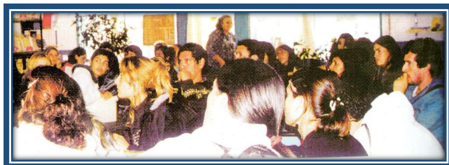
Alumnos de terciario de visita a la Biblioteca

Posteriormente las autoridades, invitados y público en general, se trasladaron al salón de la Parroquia de San Obrero, donde se sirvió un lunch y se entregaron los certificados a las personalidades de la cultura homenajeadas en la Biblioteca.