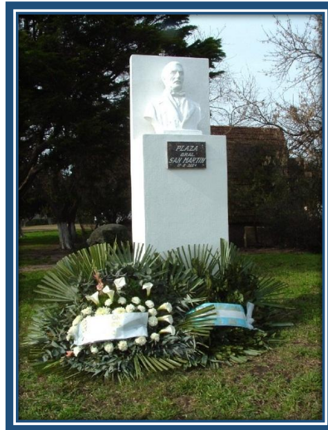
17 de agosto de 2005: 155º aniversario del paso a la inmortalidad del General José de San Martín

A partir de entonces, cada año, para el 17 de agosto, se realiza un sencillo y emotivo acto en homenaje al Libertador de Argentina, Chile y Perú.