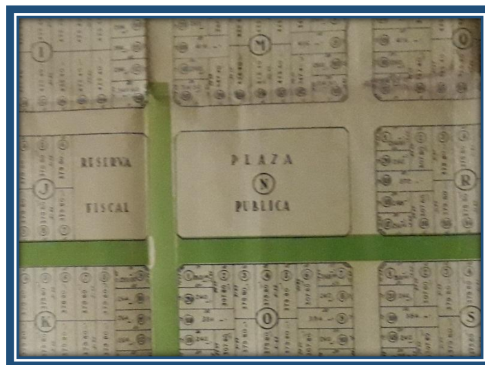
Plano parcial de loteo del Barrio Antártida Argentina

Esta plaza surge cuando la Inmobiliaria Luis Guaraglia, el 22 de octubre de 1950, en el “Año del Libertador General San Martín”, realizó el remate de 420 lotes y una casa, que dieron origen al Barrio Antártida Argentina. Una de las manzanas, la “N”, ubicada entre las calles N° 7 (actual Chile), N° 1 (después 9 de Julio, hoy Castelar), N° 8 (actual Cacique Coliqueo) y N° 3 (después Reconquista, Coronel Florencio Romero y hoy Maestro Ángel D’Elía), fue destinada para plaza pública. 1