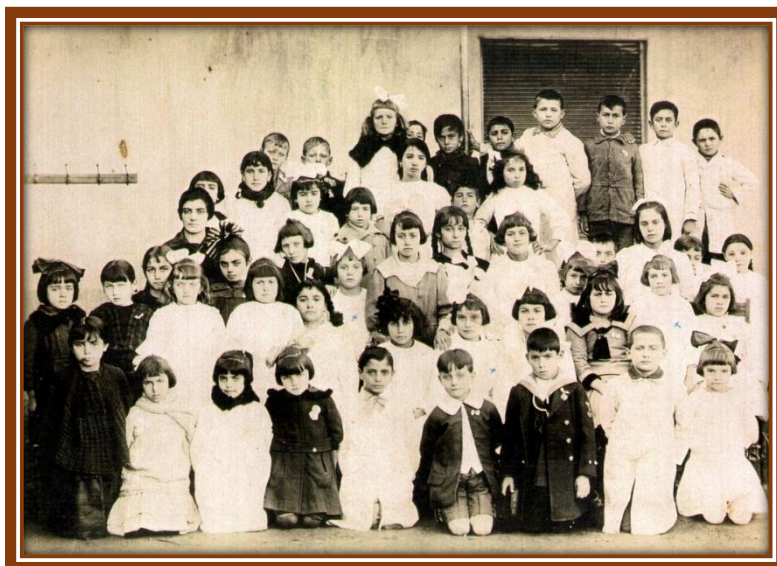
1922: Alumnos de la Escuela Nº 5

El diario “La Prensa”, publicaba una noticia proveniente de José C. Paz, fechada el 15 de enero de 1921, que expresaba: “Ha producido inmejorable impresión la noticia de que la dirección de escuelas proyecta construir un edificio escolar en este pueblo. Como se trata de una obra necesaria, reclamada insistentemente desde hace varios años por los vecinos, sería conveniente que se iniciara cuanto antes, pues en la actualidad la escuela carece de un edificio apropiado” 1 .