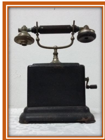
1948: Teléfono a magneto utilizado en la Cerámica Argital