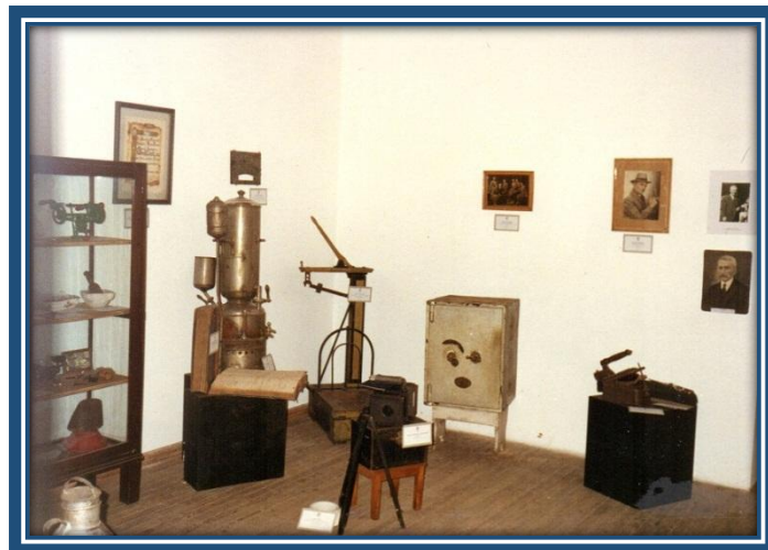
Sala N°2: "Industria y Comercio"