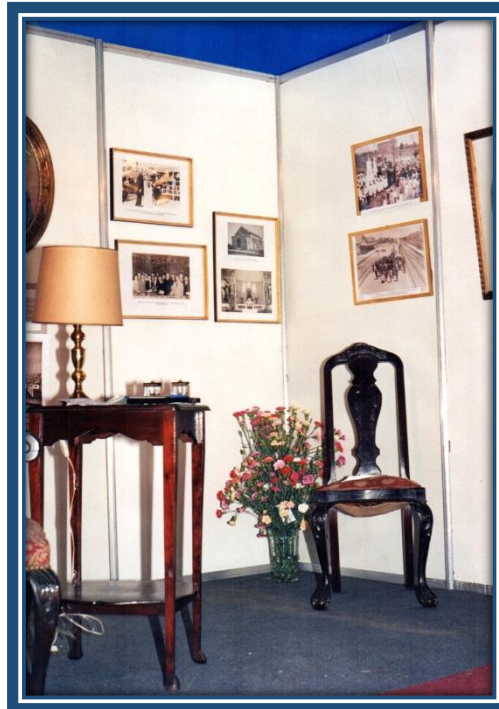
Stand en Expo-Paz

Se participó en la Expo – Paz con un stand entre el 21 y el 22 de octubre.