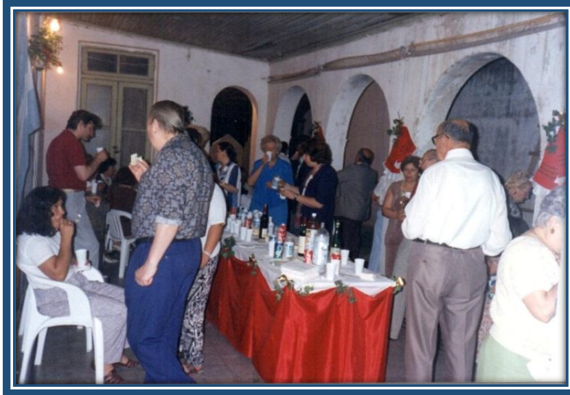
Brindis con vecinos, asociados y colaboradores

proyecto de las reparaciones a realizar para poner la casa en condiciones. Terminó el año con 69 (sesenta y nueve) asociados y un brindis de camaradería en las instalaciones del Museo.