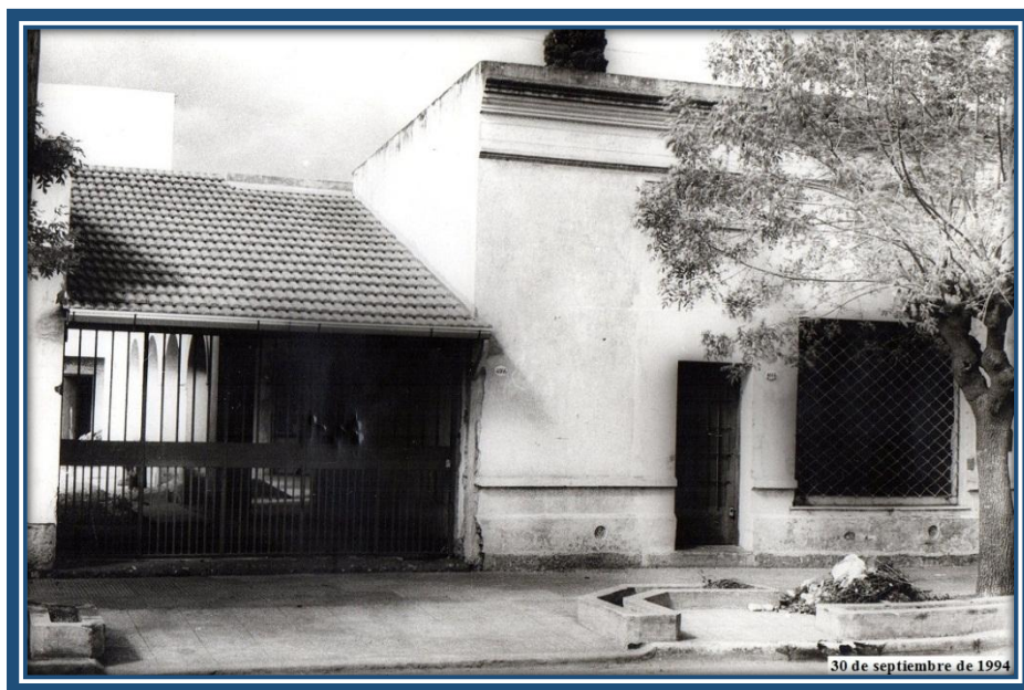
Casa de la calle Granaderos a Caballo (1994)