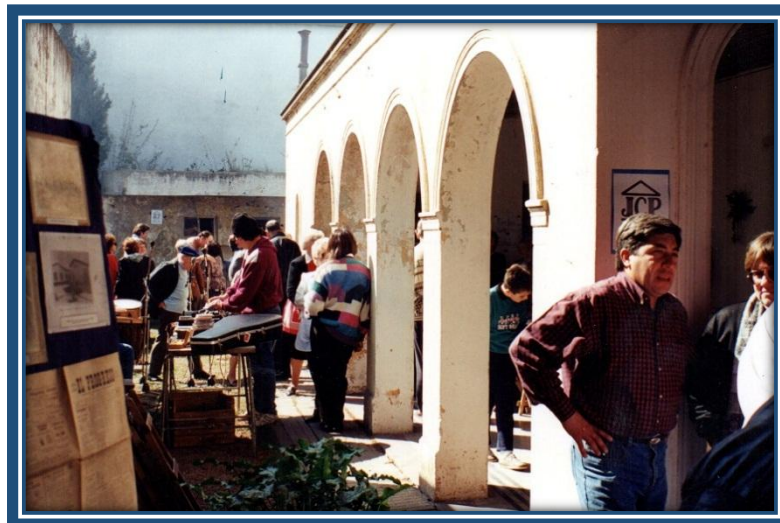
25 de junio de 1995: primer asado en la Casa del Museo