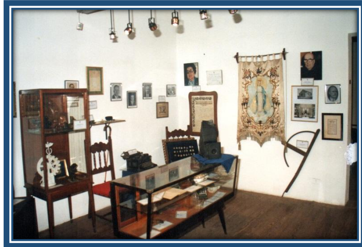
Sala Nº 3: "Social y cultural"