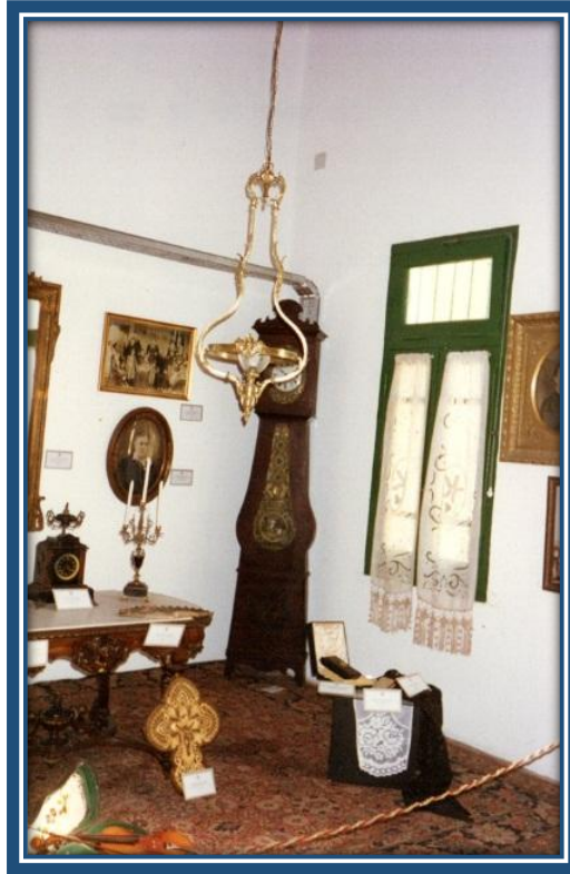
Sala N° 1: "Familia Altube"