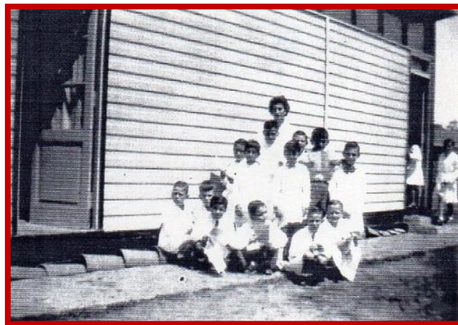
1° grado Inferior 1958

Los vecinos comenzaron las gestiones ante las autoridades escolares, la Cerámica Alberdi donó los terrenos sobre la calle Tacuarí, actual Compostela, y manos a la obra, la comunidad levantó aulas de madera con techo de chapas, la Cerámica proveyó baldosas para los pisos. Rápidamente la construcción creció y la Dirección General de Escuelas creó la Escuela N° 32 del Partido de General Sarmiento, actual Escuela Primaria N° 6 de José C. Paz, que comenzó a funcionar el 10 de junio de 1957, en una mañana fría de invierno 1 .